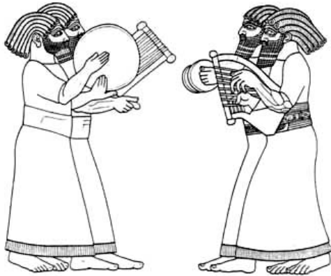
Sus. Muzicanți (relief asirian) Jos. Harpă cu membrană

Structura imnelor este compusă din 2 părți: 1) îndemnul la laudă sau cântare și 2) motivația introdusă prin „căci” prin care se invocă evenimente istorice (în așa numiții Psalmi istorici: 104–105; 113A; 77) sau chiar aspecte ale creației (așa numiții Psalmi ai naturii: 8; 18A; 103).