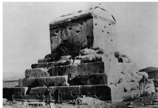
Mormântul regelui Cyrus din Pasargadae, aproape de Persepolis.

Însă doar un grup mic de evrei s-a întors din exil, în general preoți sau oameni săraci, în