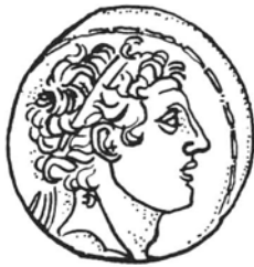
Antioh IV Epifanes reprezentat pe o monedă

În sec. 2 îdHr. a trăit în Alexandria filosoful evreu Aristobul; el încearcă o apropiere a iudaismului de operele grecești, arătând vechimea lui Moise în comparație cu filosoffii greci ca Pitagora, Socrate, Platon, dar insinuând în același timp și că aceștia din urmă ar fi fost influențați de primul. Aristobul inițiază interpretarea alegorică a Scripturii după modelul interpretării elenistice a operelor lui Homer sau Hesiod, interpretare care va fi dezvoltată de Filon Alexandrinul († 50 dHr.).