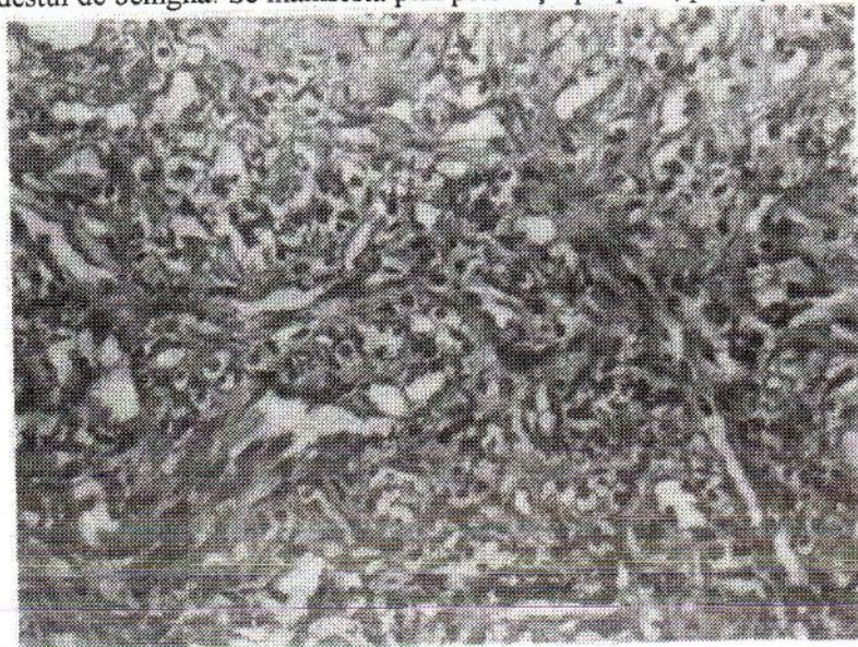
Fig. 254. Sarcomul Kaposi la un bolnav de SIDA. Afectarea pielii.

Sarcomul Kaposi (sarcomul hemoragic idiopatic multiplu) este o afecțiune rară, întâlnită de obicei la bărbații trecuți de 60 de ani, caracterizată printr-o evoluție lentă destul de benignă. Se manifestă prin pete roșii-purpurii, plăci și noduli, cu localizare de