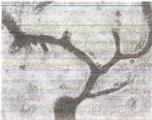
Fig. 257. Stază în vasele patului microcirculator cu agregarea eritrocitelor în tifosul exantematic experimental (preparatul lui A.P. Avțin).

Rickettsiozele reprezintă un grup de boli, provocate de microorganisme din genul rickettsiilor, care actualmente sunt plasate în grupul bacteriilor. Însă unele particularități ale rickettsiilor (parazitarea în celulele endoteliului și mezoteliului), precum și particularitățile epidemiologice și clinico-morfologice ale maladiilor provocate de ele, permit să evidențiem un grup special de afecțiuni, numite rickettsioze. În condiții naturale rickettsiozele se întâlnesc la artropodele hematofage (păduchi, purici, căpușe), la unele animale sălbatice și domestice, inclusiv și la oameni. Rezervorul natural al infecției rickettsioase îl constituie căpușele, animalele sălbatice și domestice. Omul bolnav este sursa de infecție numai în caz de tifos exantematic