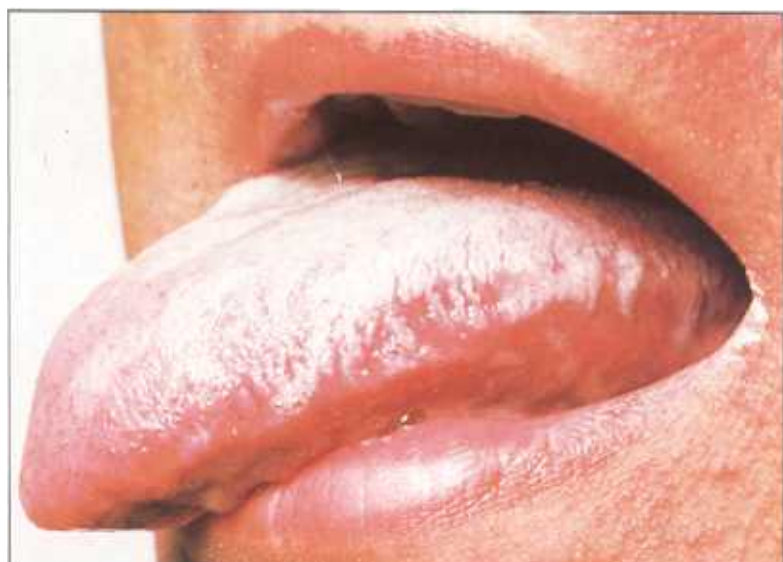
● Afte bucale și leucoplazia păroasă apar adesea pe limba bolnavului de SIDA. Aftele bucale apar sub forma unor pete albe pe limbă; leucoplazia constă în niște bube albe de-a lungul limbii.

A treia cale de contactare a virusului este prin sânge sau prin lichidele corpului, de obicei prin injecție. Înainte ca sângele să fie testat pentru HIV, unele persoane infectate au apucat să doneze sânge. Unii dintre cei care au primit sânge contaminat au fost infectați. În prezent, sângele donat este examinat cu atenție, în scopul prevenirii răspândirii virusului HIV prin transfuzii. Virusul poate fi transmis și prin re folosirea unui ac hipodermic nesterilizat, sau a unei seringi nesterile, deja folosite de o persoană infectată.