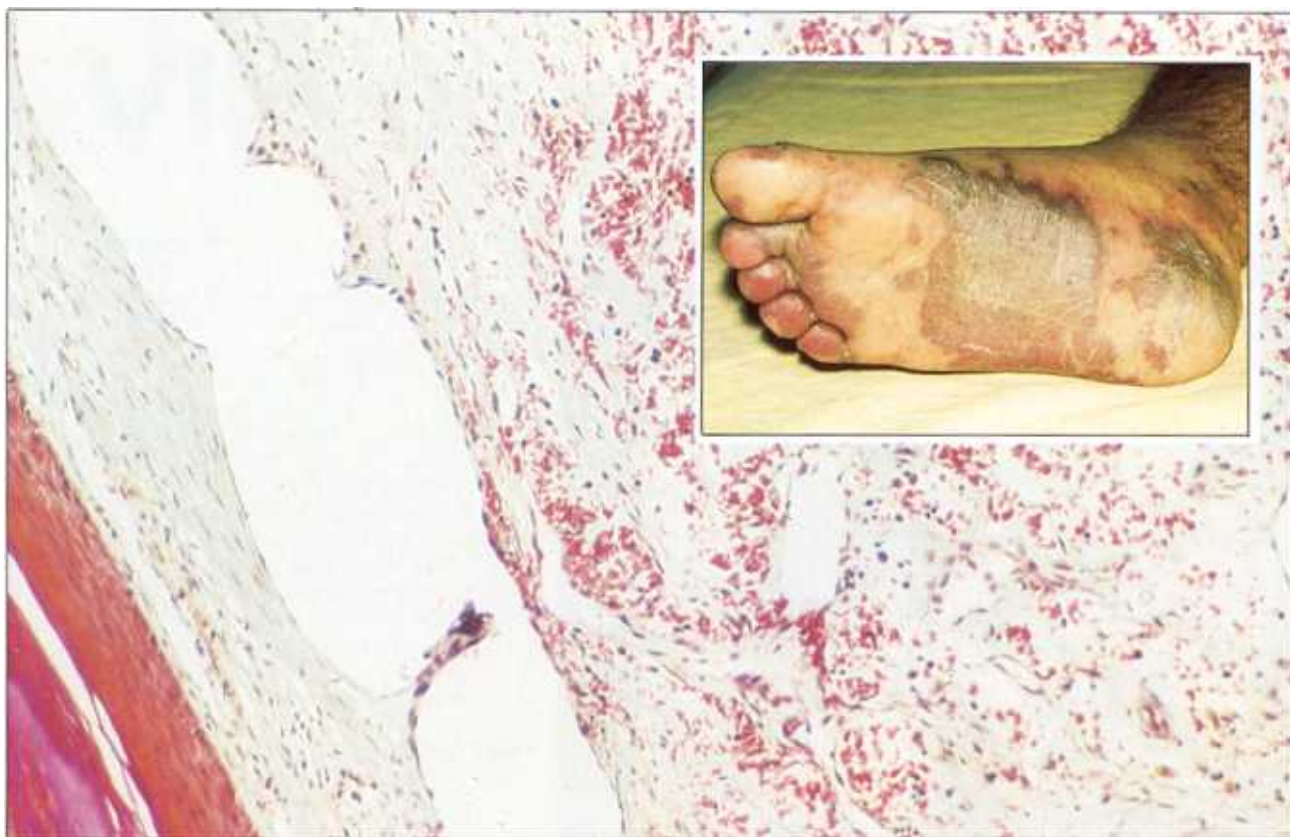
● Secțiune de piele afectată de sarcomul lui Kaposi. Stratul extern al pielii are culoarea roșie, stratul interior (alb/gri) prezintă un număr mare de vase sangvine (pete roșii) caracteristice acestui tip de cancer al pielii. Leziunile grave ale pielii (imaginea din interior) apar ca urmare a evoluției bolii.