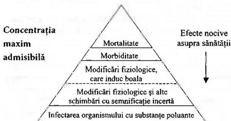
Fig. 24. Domeniile de acțiune a substanțelor nocive asupra organismului (după M. Barnea, Al. Calciu).