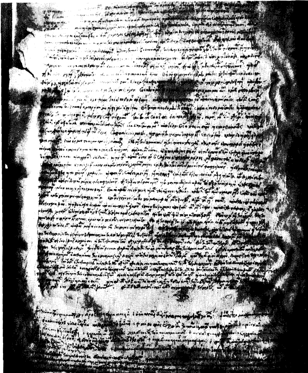
Γράμμα της ιερᾶς συνάξεως — Ἰανουάριος 1541 (καταλ. ἀρ. 9α).