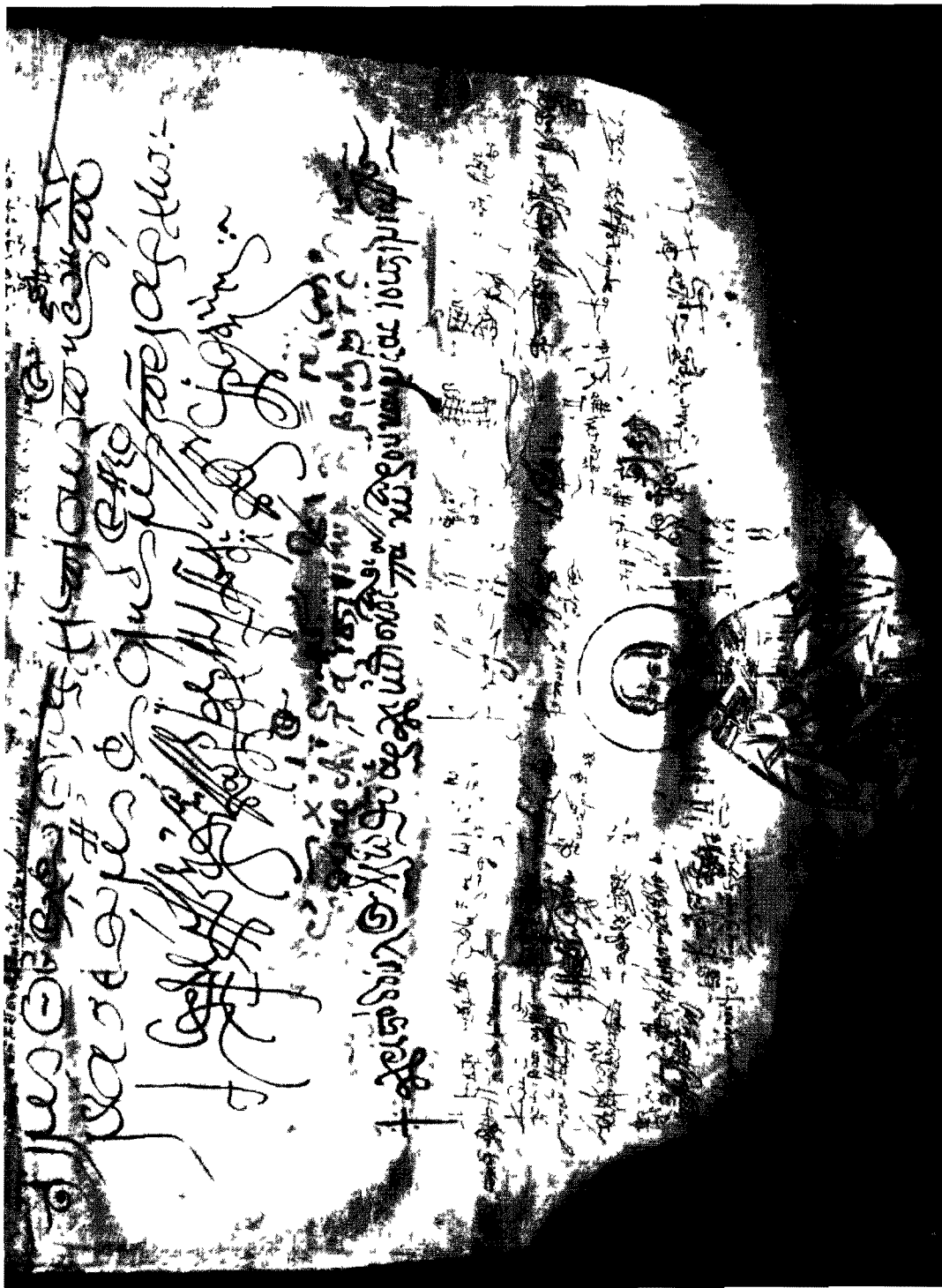
Πατριάρχων καὶ συνοδικῶν συγκλήσεις γράμμα τοῦ πατριάρχειου Τιμολέου - 5 Β' - 21 Ιουλίου 1614 (γραμ. ἀρ. 5, ἀπογραφου)