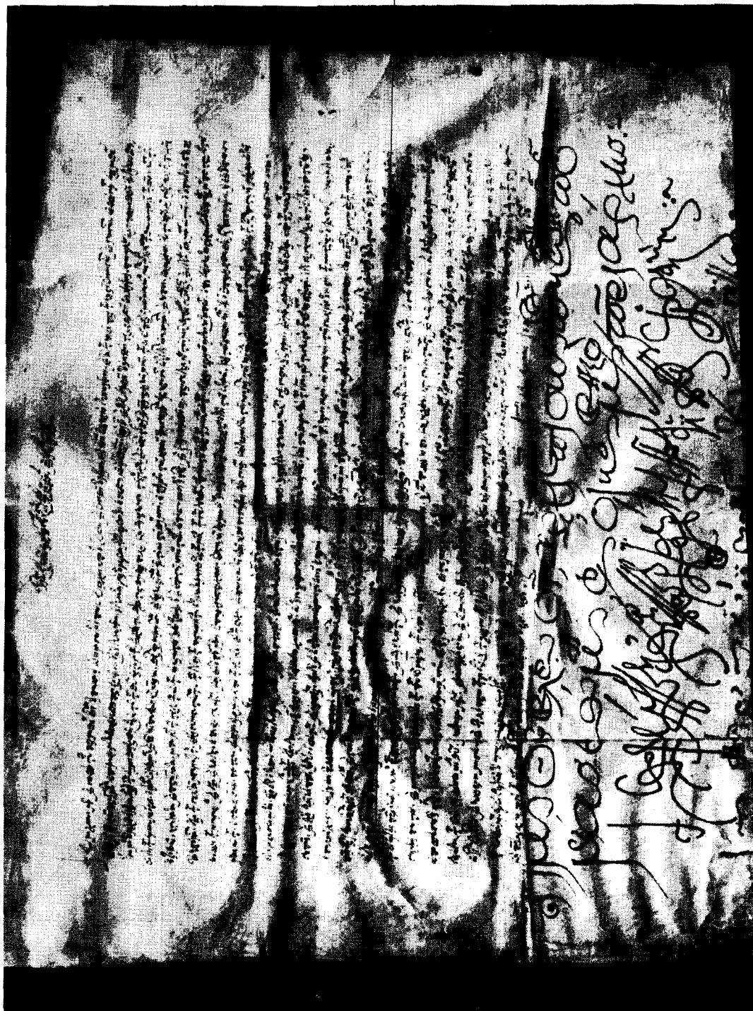
Πατριαρχικόν και συνοδικόν σιγγιλιώδες γράμμα τοῦ Πατριάρχου Τιμοθέου τοῦ Β΄. — 21 Ἰουλίου 1614 (καταλ. ἀρ. 5 : ἄνω μέρος).