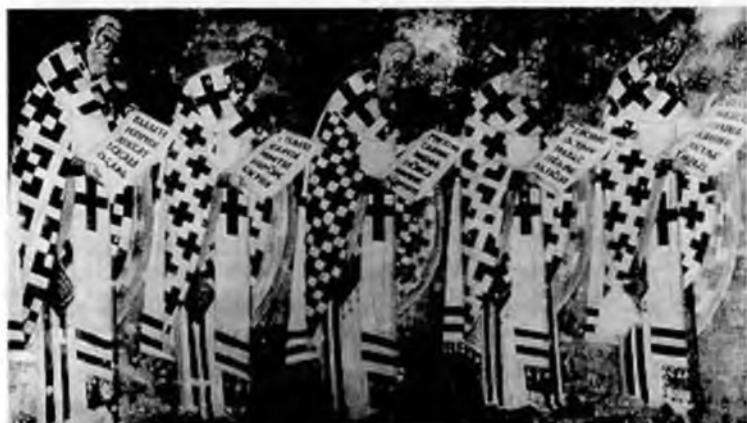
Fig. 2: La procession des Pères, officiant (Grégoire de Nazianze, deuxième en partant de la droite), au registre inférieur de « La communion des Apôtres », sur le mur incurvé de l'abside de l'église du monastère de Sopoćani, Yougoslavie, deuxième moitié du XIII e s.