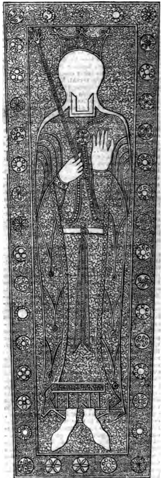
Tumulus Fredegundæ Reginæ.

A solio regni locato urbes amissas restitui curavit, alias vi et 1377 artificio acquisivit, cumque de aliis regibus triumphantem gloria et divitiis cumulatum moriens reliquit : unde mirum nemini videri debet, si eo mausoleo a filio donata est. Quare ipsum ari incisum hic exhiberi visum est.