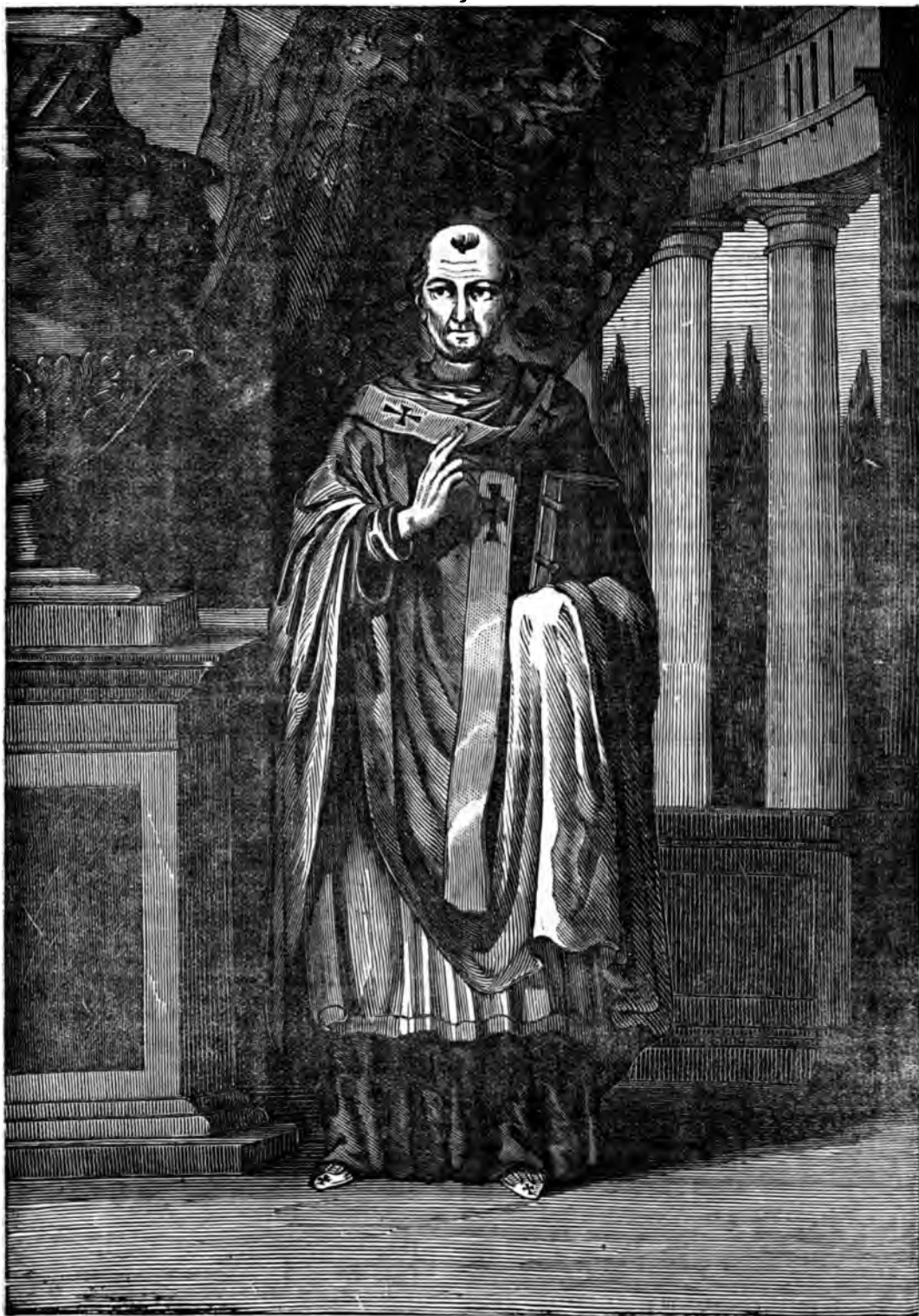
VERA S. GREGORII MAGNI EFFIGIES.