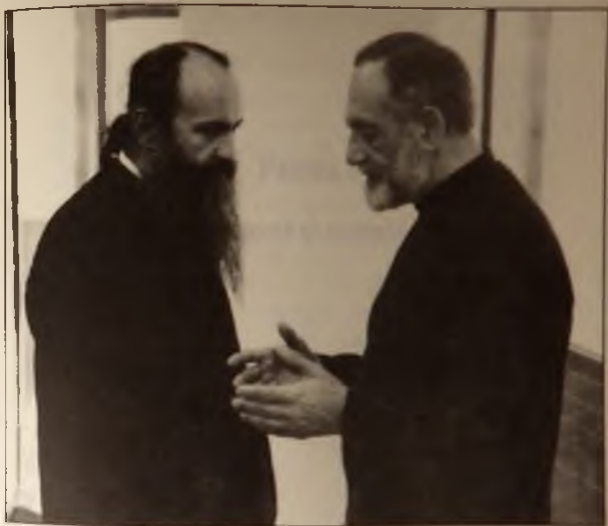
In Vancouver, Canada, 1995