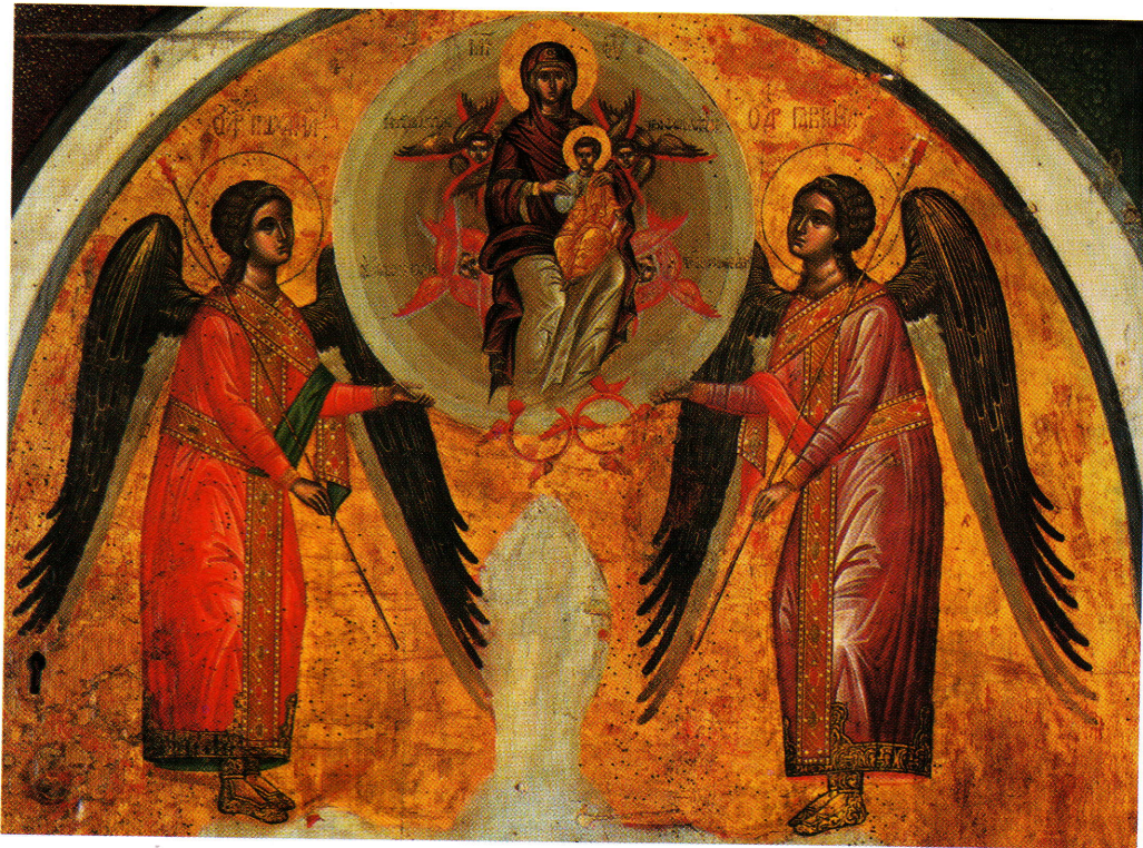
Θεοτόκος ἡ τιμιωτέρα τῶν Χερουβίμ, διάκοσμο τῆς Ὁραίας Πύλης τοῦ Τέμπλου τῆς Μονῆς Ἁγ. Αἰκατερίνης Σινᾶ, β' μισό 16 ου αἰ., Μουσεῖο Ζακύνθου. Mother of God greater in honour than the Cherubim, from the ornamentation of the Holy Doors of the Sanctuary, second half 16 th century, Monastery of St. Catherine of Sinai, Zakynthos Museum, Greece .