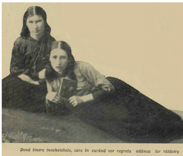
Două tinere inochentiste, care în curând vor regreta adâncă lor rătăcire