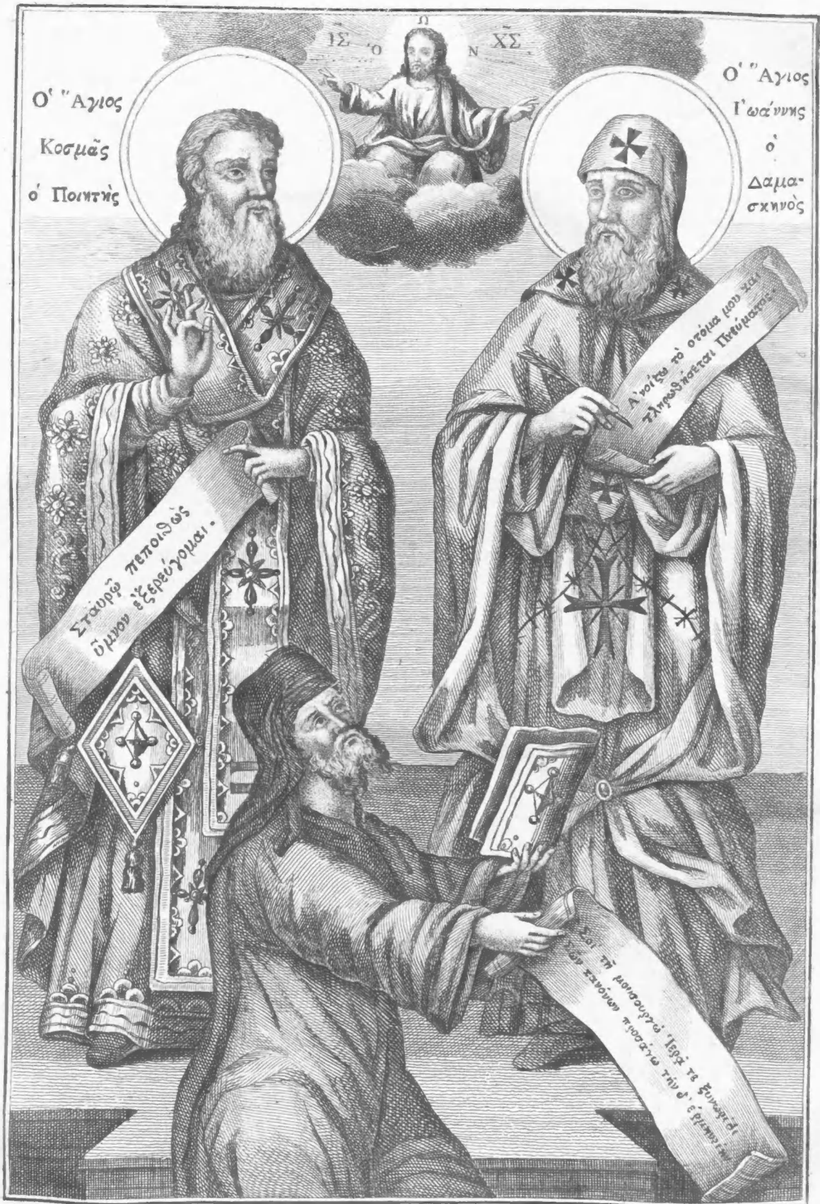
Νικόδημος Μοναχὸς Ἀγιορείτης ὁ ἐρμηνεύσας τοὺς Ἱερὺς Κανόνας.