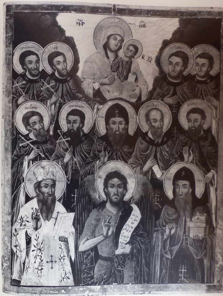
Οι Ένδεκάριθμοι Διονυσίατοι Ἅγιοι. Φορητή εἰκὼν, 1837.