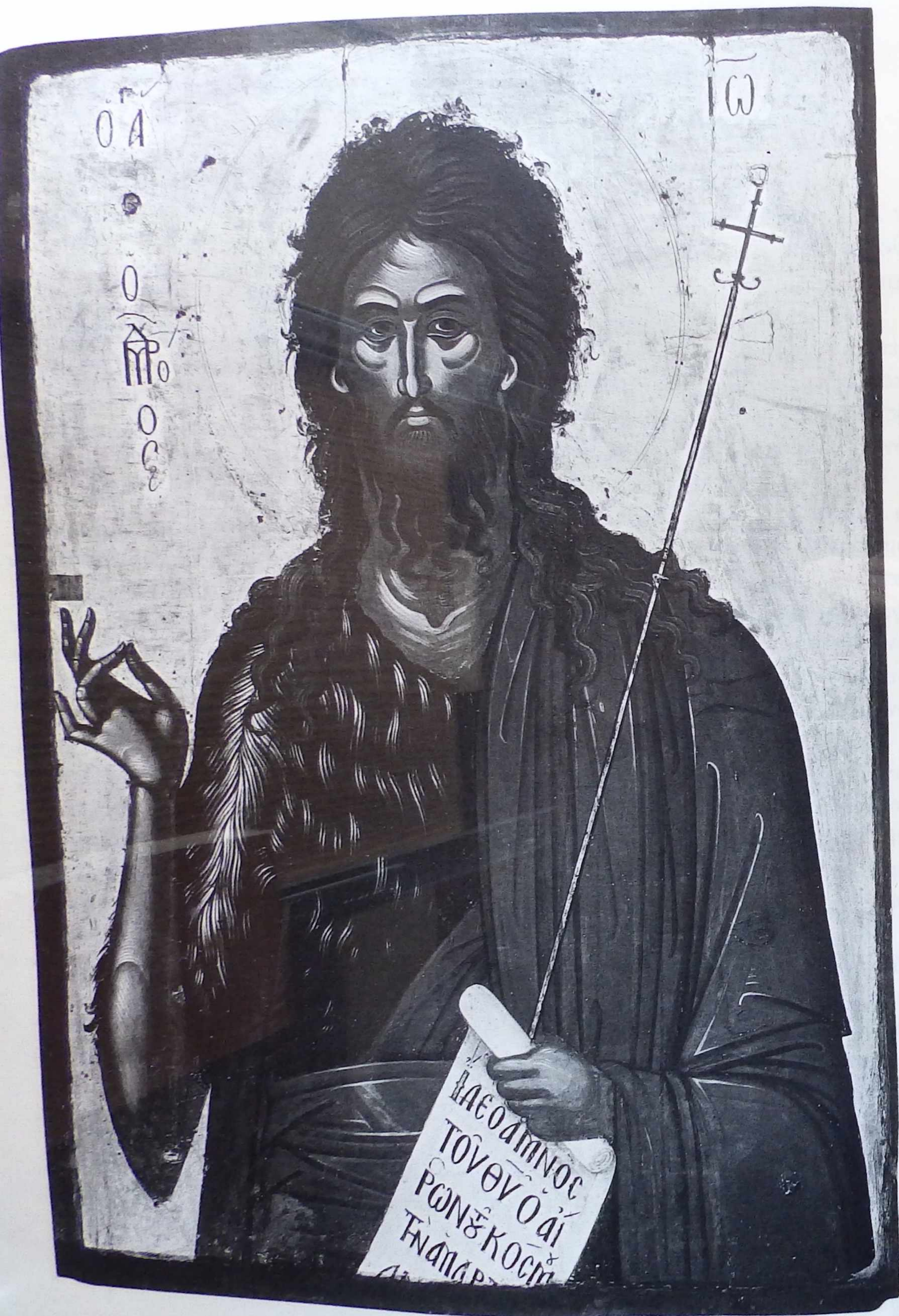
Ο Άγιος Ιωάννης ο Πρόδρομος, έφέστιος εικών του Καθολικού, 16ος αϊ.