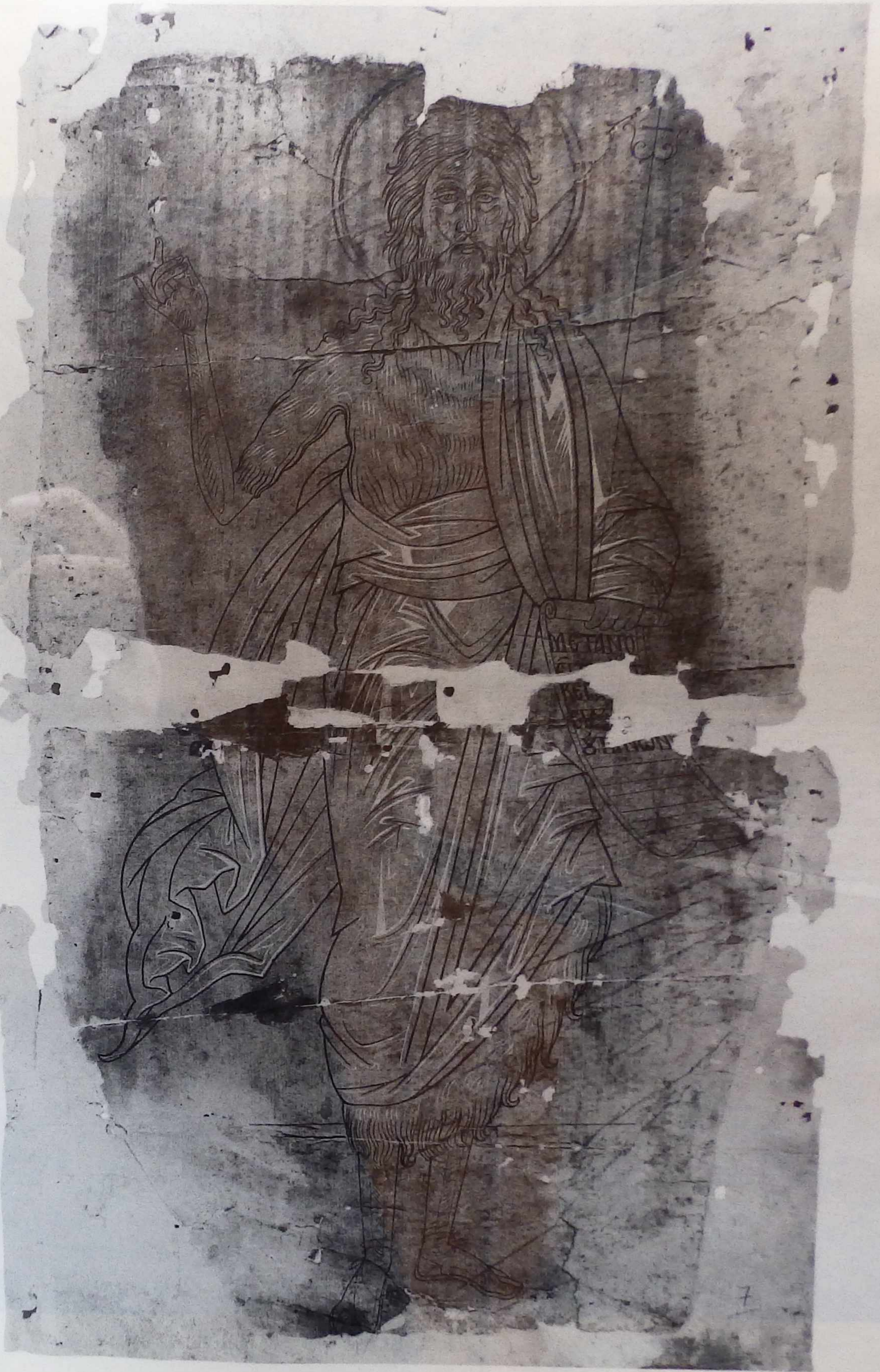
Ὁ Ἅγιος Ἰωάννης ὁ Πρόδρομος, ἀντίβολον, 16ος αἰ.