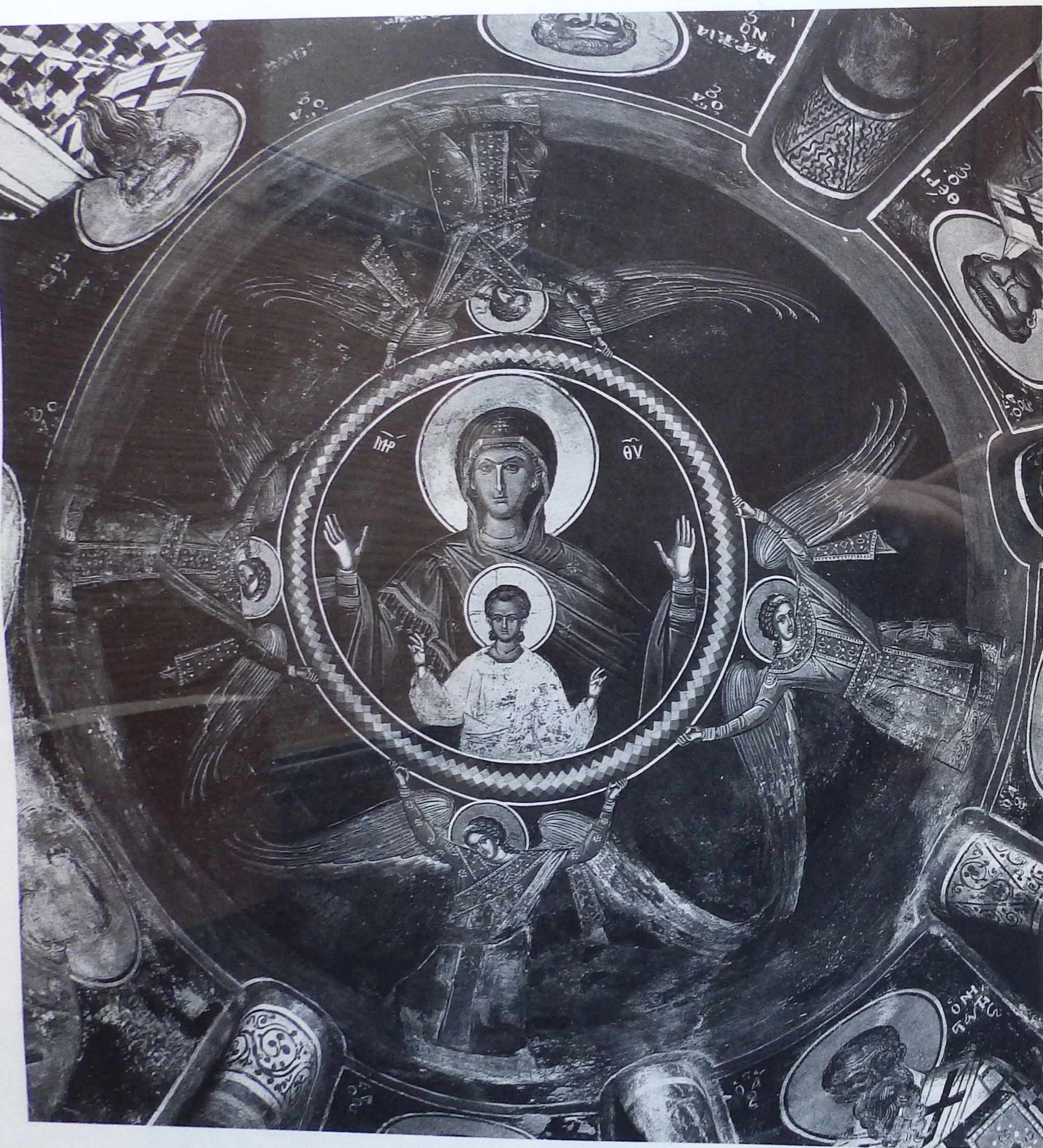
Ἡ Θεοτόκος Βλαχερνίτισσα. Τοιχογραφία τοῦ Τυπικαριοῦ, 1546.