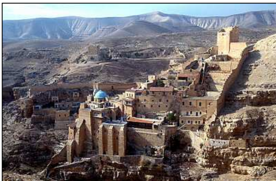
Mănăstirea Sf. Sava (Mar Saba) de lângă Ierusalim

La noi în prezent de asemenea se simte necesitatea de a formula o rânduială tipiconală locală care, pe de o parte să combine tradițiile slavă și româno-bizantină, iar pe de altă parte să dea un caracter oficial unor rânduieli locale sau generale neprevăzute de vechile Tipicuri.