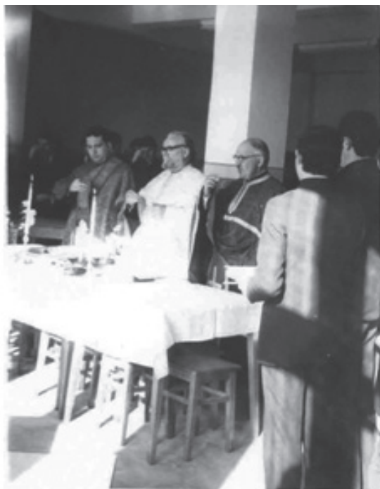
Slujba de sfințire a noului edificiu la 3 aprilie 1973.

Sub aspect administrativ-organizatoric, s-a finisat în 1963 noua clădire a căminului-internat pentru elevi, dotat cu mobilierul necesar. S-a organizat biblioteca seminarului, înființându-se în 1964 un post de bibliotecar. În 1967 s-au amenajat sălile de clasă, sălile de dulapuri și localul arhivei școlii, dotate cu cele necesare. În 1968 s-a pictat capela fostei episcopii (dată în folosința școlii încă din 1963), iar dormitoarele au fost dotate cu un nou mobilier. În 1969 s-a efectuat lucrarea