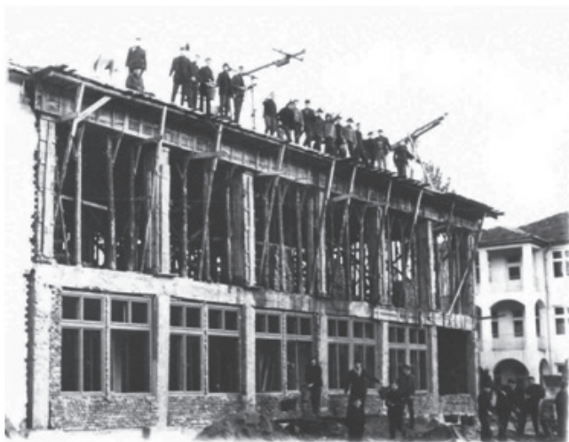
Construcția sălii de mese și a sălii festive – vara anului 1972.

Profesorii de la seminar și aceiași de la reactivata facultate de teologie din Caransebeș au colaborat cu regularitate la revista mitropolitană și la Îndrumătorul bisericesc al Arhiepiscopiei Timișoarei. De fapt, mulți dintre ei au fost deja antrenați în această activitate în perioada când își făceau studiile doctorale ca fii ai Mitropoliei Banatului. În această activitate au fost antrenați și elevii seminariști dornici să exercite activitatea de cercetare și studiul teologiei, încât mulți dintre