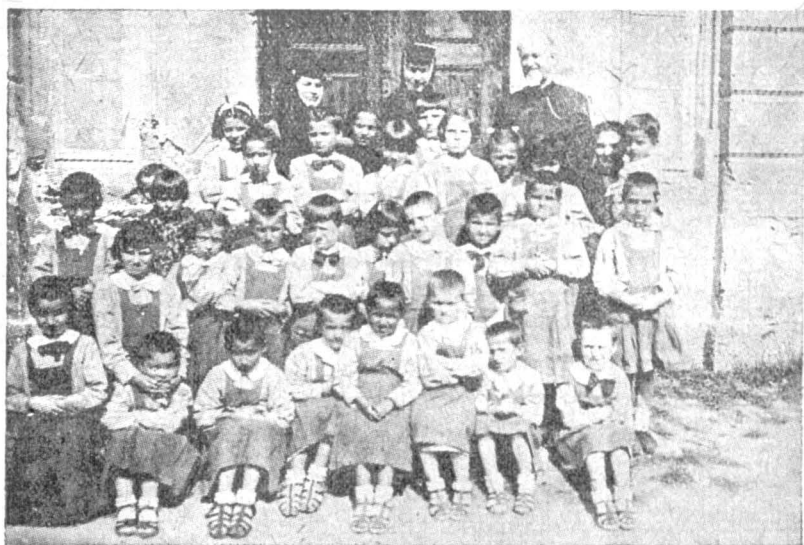
Orfelinatul de fete din Sf. Mânăstire Țigănești.