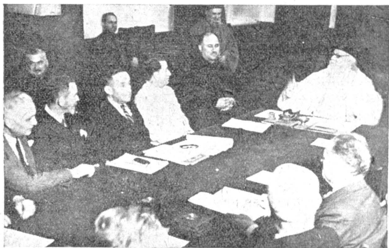
I. P. S. Patriarh Nicodim prezidând Adunarea Eparhială.

În altă ordine de idei, I. P. S. Patriarh Nicodim se ocupă în cuvântarea Sa despre problema secularizării școlilor bisericești și amintește că, recent P. C. Preot Burducea, Ministrul Cultelor a luat școlile bisericești dela Ministerul Culturii Naționale și le-a