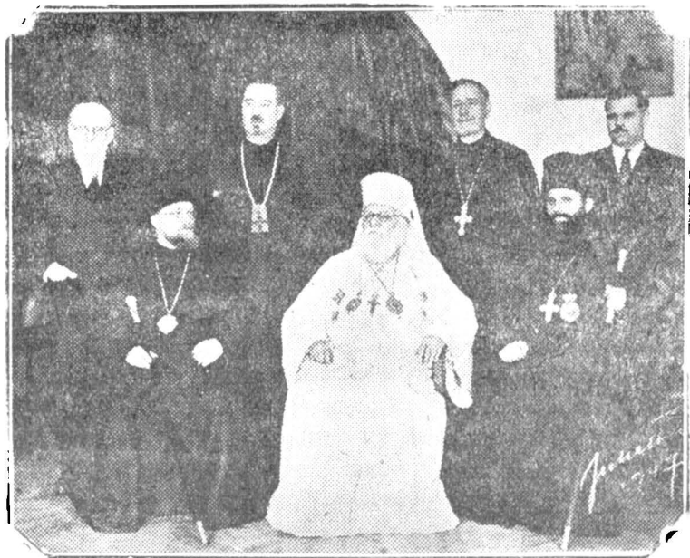
I. P. S. Patriarh Nicodim în mijlocul delegației care l-a însoțit cu prilejul vizitei la Moscova făcută de I. P. S. Patriarh Alexei al U. R. S. S.