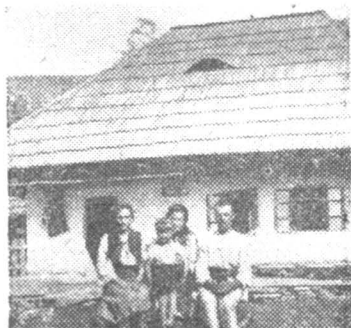
Casa în care s'a născut I. P. S. Patriarh Nicodim.

La plecare ne-am fotografiat în fața casei din Pipirig, rânduindu-ne pe o prispă de lut. Evuța fetița nepoatei Varvara, s'a