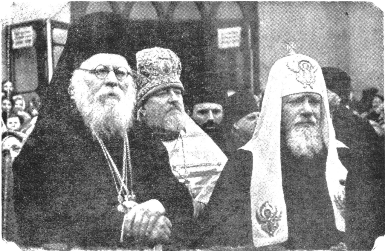
I. I. P. P. S. S. LOR Patriarhii Alexei al Rusiei și Nicodim al României, la Moscova.