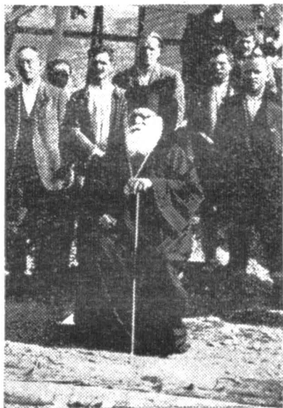
I. P. S. Patriarh Nicodim în satul natal.