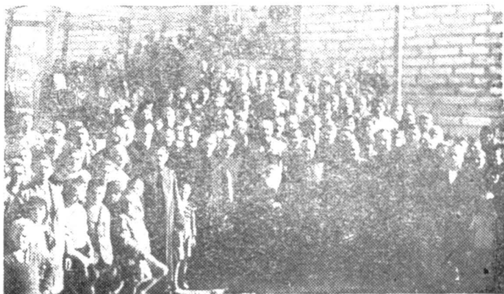
I. P. S. Patriarh Nicodim. Înconjurat de P. P. C. C. Consilii-1 și Protopopii cu ocazia vizitei acestora la Mănăstirea Neamțu și Pipirig.

Iar când intrăm în Pipirig, ne surprinde iarăși lipsa bărbaților. Numai femei cu fuioarele de lână și cu furca în brâu, torc și când merg pe drum, urmate de câte un țânc scâncind, agățat de poala fustei. Socotim că bărbații vor fi în pădure la lucrul lemnului. Sunt mulți și în codru, dar o bătrânică căreia îi mărturisisem nedumerirea mea, mă lămuri, rostind odată cu un oftat scos dureros din foii plămânilor: «Războiul maică, bătut-l'ar focul gheenei»... Da, războiul. Câte văduve, câți orfani, câte mame care au rămas doar cu amintirea celor plecați pentru totdeauna. De pe prispa casei câte o femeie punând mâna stra-