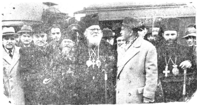
I. P. S. Patriarh întâmplinat de membrii Guvernului în gara Mogoșoala, la însoțirea dela Moscova.

Faptul se datorește în bună parte și conduitei clerului bisericii ortodoxe de acolo, care a înțeles să se încadreze în organizația statală.