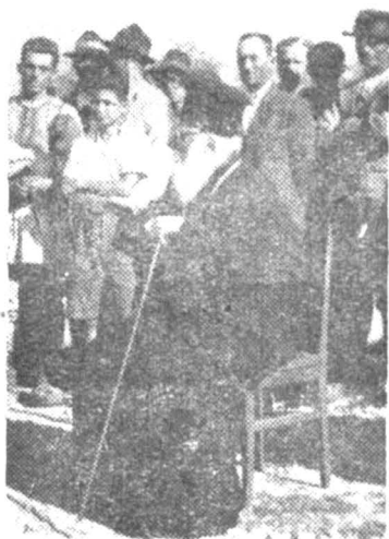
I. P. S. Patriarh Nicodim stând de vorbă cu un grup de pîrigeni.