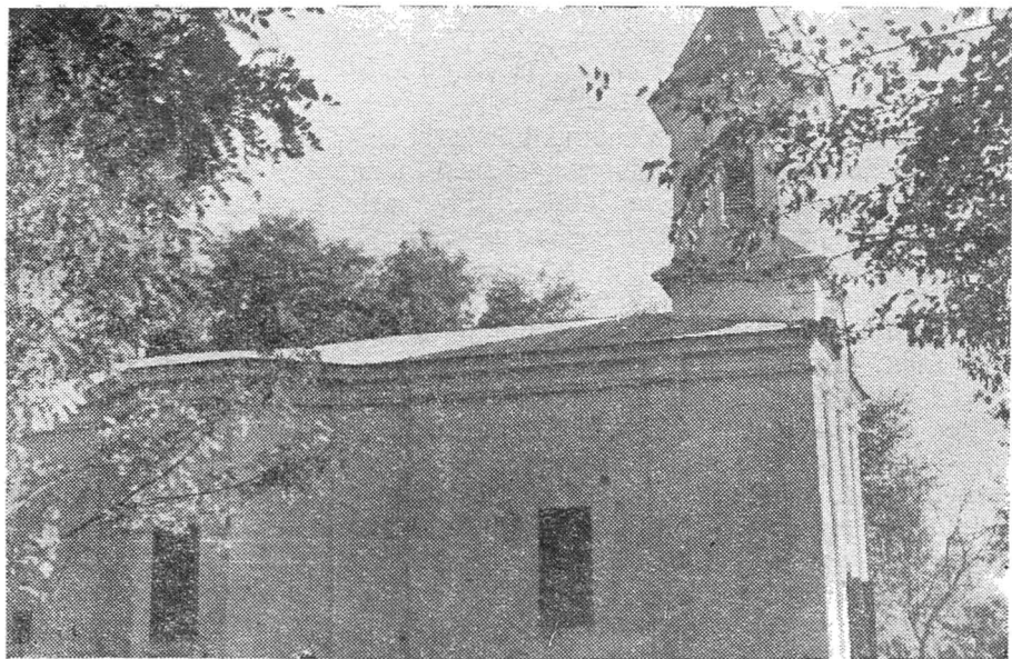
Fig. 2. Biserica fostului schit Babele. Vedere laterală, nord.

Din această pisanie aflăm astfel de o ctitorie în Vlașca a lui Vlad vodă Călugărul (1482-1496), înaintea aceleia bine cunoscută de la Glavacioc unde, după tradiție, i se odihnesc și oasele. Asupra autenticității pisaniei citită de mitropolit, nu ne putem îndoi, mai întâi pentru că este