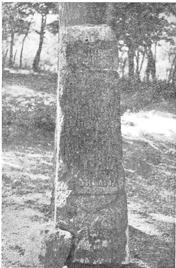
Fig. 3. Crucea mutilată de la Podul Doamnei (sec. XVIII).

Curînd, schitul refăcut începe să prospere și să-și îmbunătățească starea gospodăriei. Astfel, la 11 iunie 1636 (7144) Matei vodă Basarab întărește minăstirii «un rumăn anume Balea și feciorii lui căți Dumnezeu îi va dărui, pentru că acest rumăn iaste de moșie din Șteferi și tot l-au ținut mănăstirea cu pace», 17 dîndu-l rămas pe Chiriac din Stoenești.