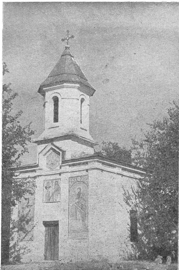
Fig. 1. Biserica fostului schit Babele. Vedere generală, frontală, sud-vest.