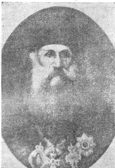
Episcopul Inochentie Chitulescu