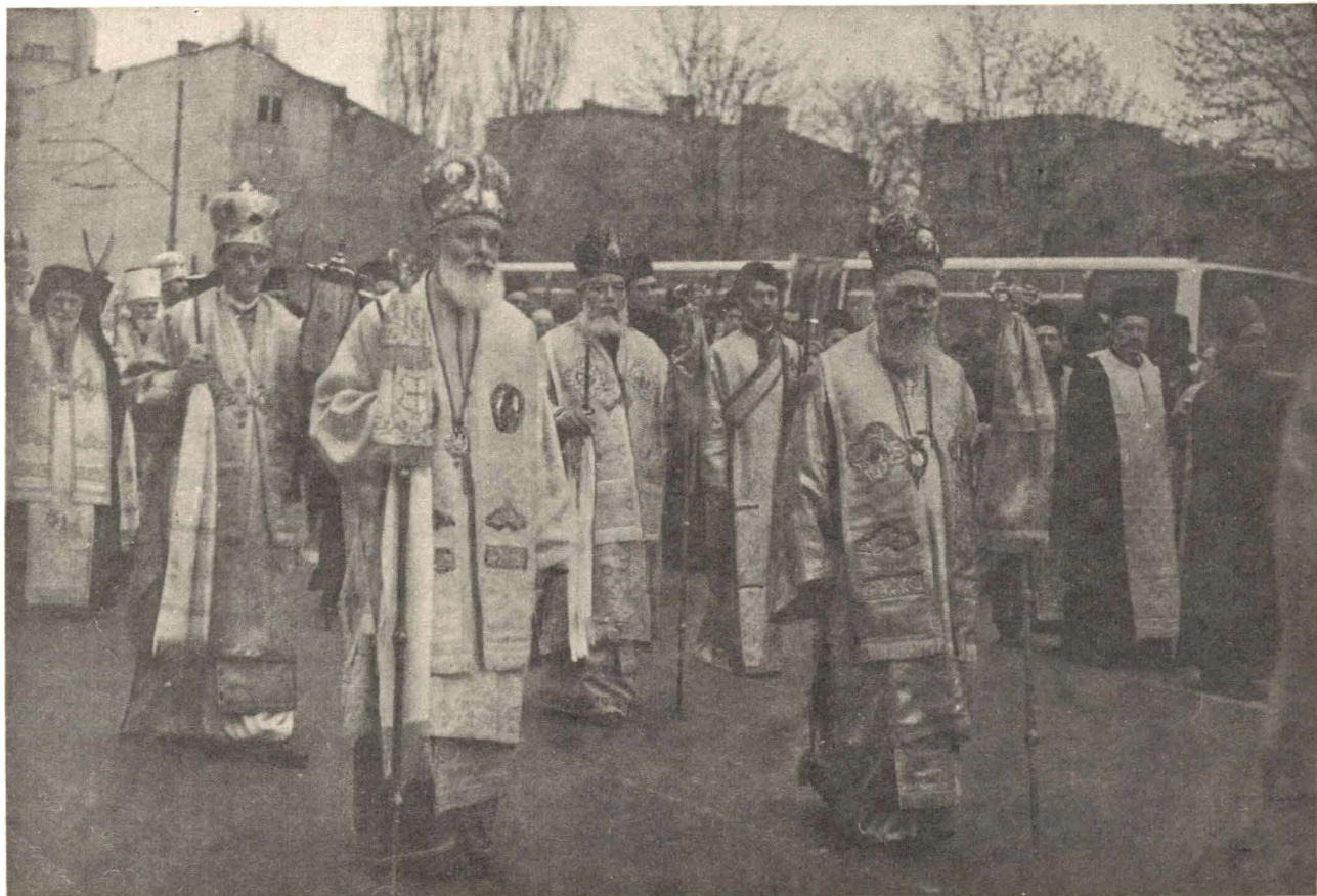
Membrii sfântului Sinod al Bisericii Ortodoxe Române, delegați străini, șefii de culte din România, clerici, monahi și monahii, credincioși însoțind pe ultimul drum pe Patriarhul Justinian https://biblioteca-digitala.ro / https://bibsinosd.ro