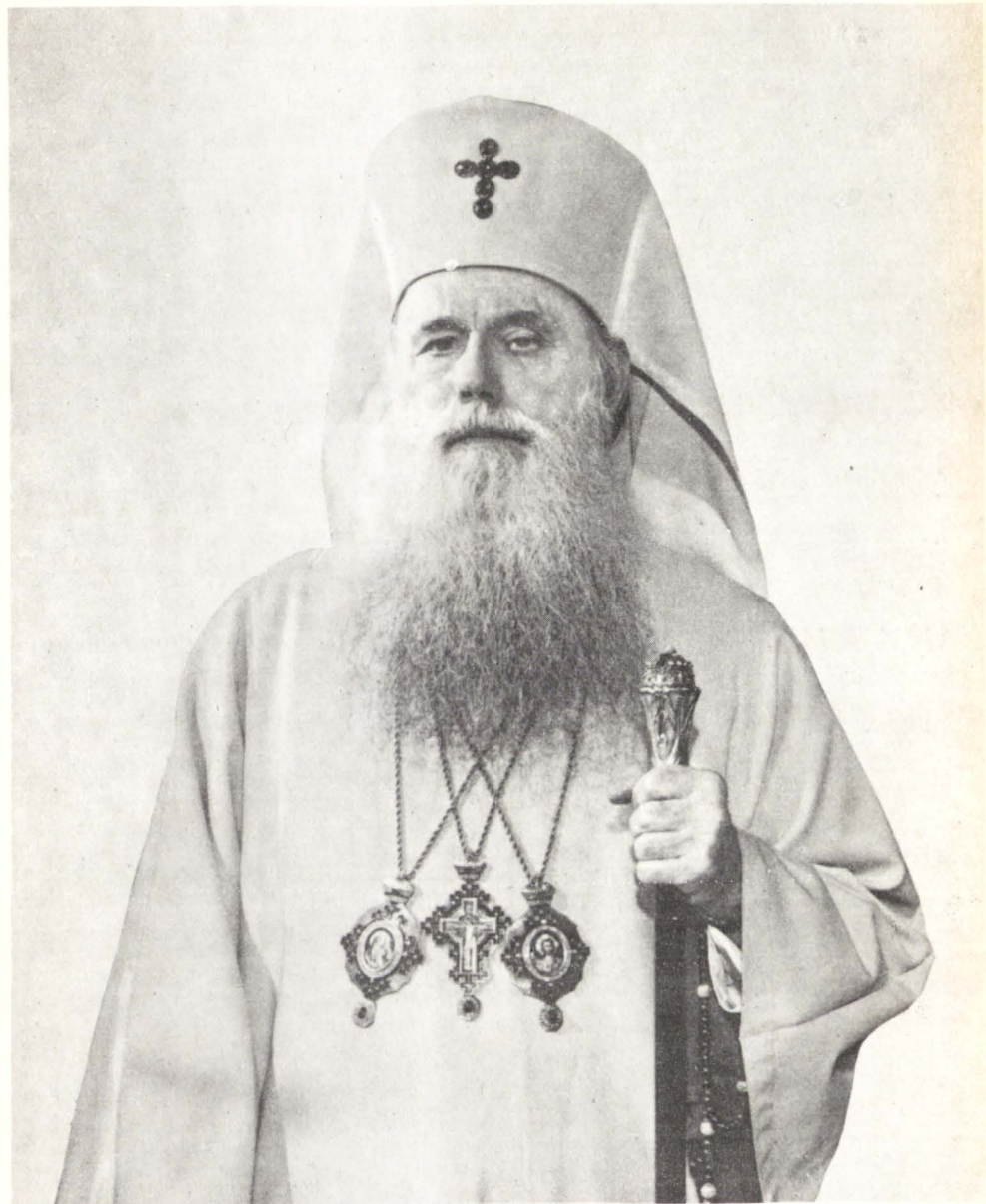
PREA FERICITUL PĂRINTE JUSTINIAN PATRIARHUL BISERICII ORTODOXE ROMÂNE 1901 - 1977