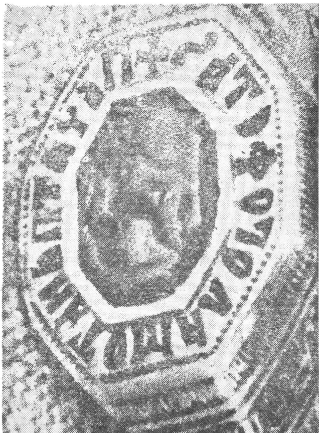
Fig. 1. Matricea negativă a peceții lui Toma logofătul (Detaliu).