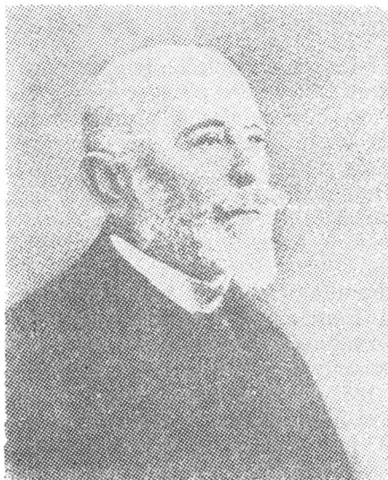
Gheorghe Pop de Băsești (1835—1919)

La întrunirea reprezentanților românilor din cercul electoral Cehu Silvaniei, ținută la Băsești, au participat aproximativ 150 de persoane. S-a făcut un aspru rechizitoriu la adresa guvernului de la Budapesta, care nu-și respectă nici măcar propriile legi: legea naționalităților există doar pe hirtie — sublinia în cuvântul său George Pop de Băsești —, românii sînt ținuți departe de funcțiile publice, în întreg comitatul existînd doar un singur funcționar român, la sedria orfanală, iar acum această lege, care jignește și încalcă drep-