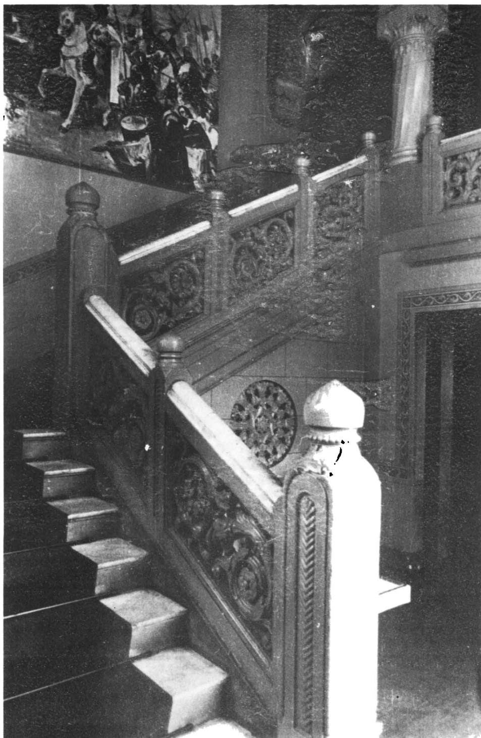
Scara monumentală a sălii Muzeului Arhivelor, distrusă la demolarea Complexului de la Mihai Vodă

https://biblioteca-digitala.ro / http://arhivelenationale.ro