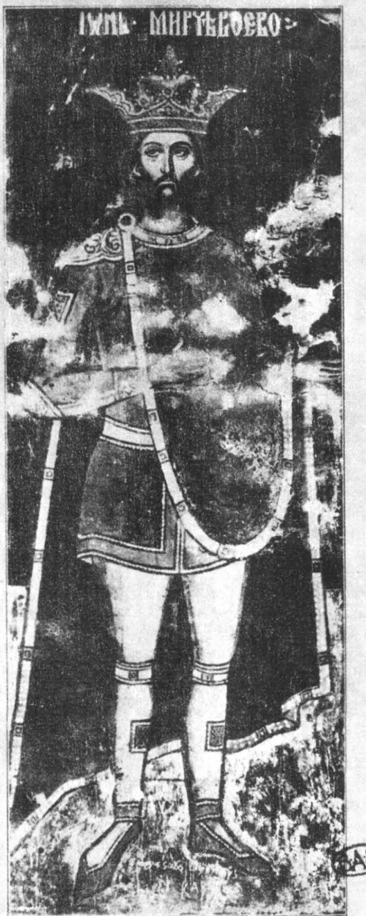
MIRCEA-CEL-BĂTRÂN, 1386-1418 DOMN AL ȚĂRII-ROMÂNEȘTI

după fresca din biserica episcopală de la Argeș