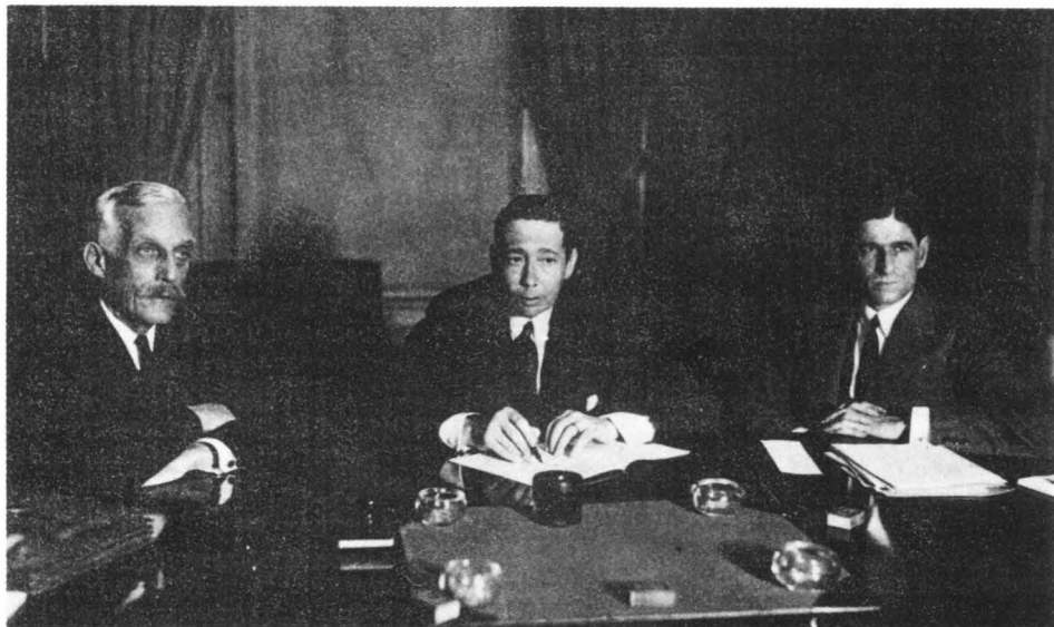
Semnarea acordului cu Statele Unite privind datoriile de război ale României (1925)