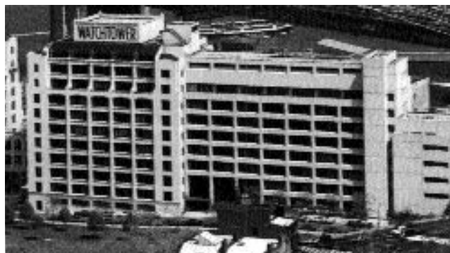
Sediul central al organizației "Martorii lui Iehova"

tuire. Dar dacă el însuși nu a ajuns la aceste concluzii în mintea lui, el va fi ofensat și va respinge orice altceva vei spune în continuare. Trebuie să-i ghidăm gândirea în direcția concluziilor corecte la care dorim să ajungă. În loc să spunem: "la te uită ce spune acest verset! Iisus este Dumnezeu", îl putem ruga să citească versetul cu voce tare și apoi îl întrebăm: "La cine crezi că se referă autorul în acest verset? Ce spune despre El?" Chiar dacă martorii evită să răspundă, vei vedea că se schimbă la față când descoperă adevărul. Trebuie să ne purtăm cu răbdare și înțelegere dacă dorim să-i ajutăm pe cei care au fost înșelați. Încercați să vă puneți în locul lor. Aduceți-vă aminte de Matei 7,12: "Tot ce vreți să vă facă vouă oamenii, faceți-le și voi la fel." Apostolul Pavel demonstrează acest fel de înțelegere în predica sa din Atena (Fapte 17,16-34). Scriptura ne spune că "i se întărâta duhul la vederea acestei cetăți pline de idoli." Și totuși, în loc să-i mustre pentru idolatria lor, Pavel se abține, și caută un lucru pe care-l au în comun, pe baza căruia îi poate chema la mântuire. El le spune: "Bărbați atenieni! În toate prvințele vă găsesc foarte religioși. Căci pe când străbăteam cetatea voastră și mă uitam de aproape