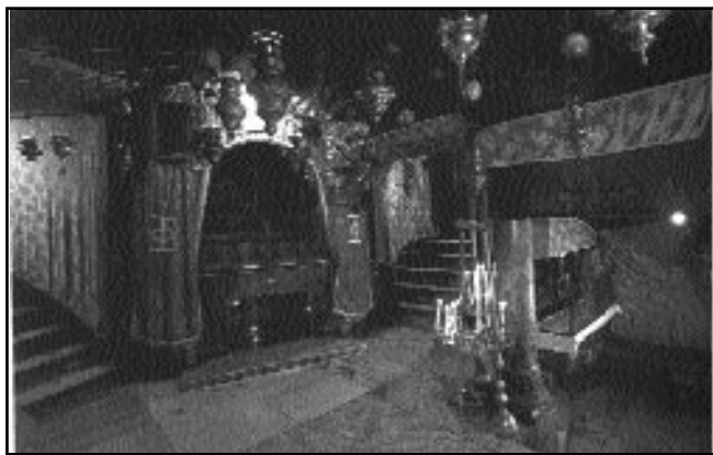
Betleem, peștera în care s-a născut Mântuitorul

Cu ocazia împlinirii jubileului de 2000 de ani de la Întruparea Domnului au sosit la Betleem Întâistătorii Bisericii Autocefale și conducătorii țărilor ortodoxe. În decursul unei săptămâni au fost ridicate rugăciuni speciale la cele mai sfinte locuri ale creștinilor. Deosebit de solemn au trecut slujbele religioase la Betleem, unde S-a născut Mântuitorul în urmă cu 2000 de ani.