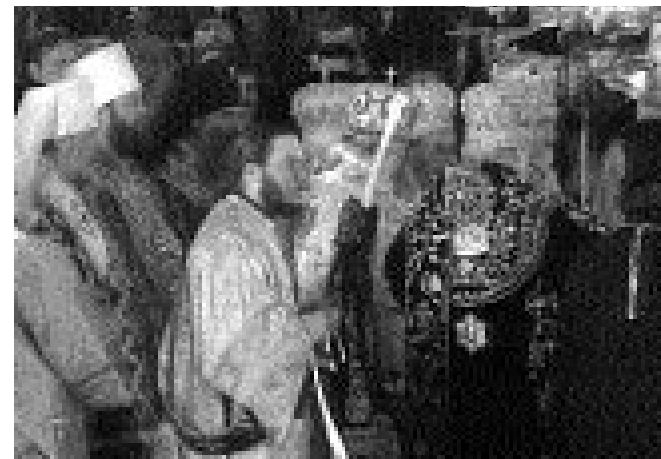
Betleem, bazilica "Nașterea Mântuitorului" Secvență de la serviciul divin din 7 ianuarie 2000

că din cauza mozaicului ce se afla atunci pe fațada ei: cei trei magi veniți să se închine și să aducă daruri pruncului Iisus (Mt. 2,1-2) erau zugrăviți purtând haine persane și se crede că acest fapt i-a determinat pe persani