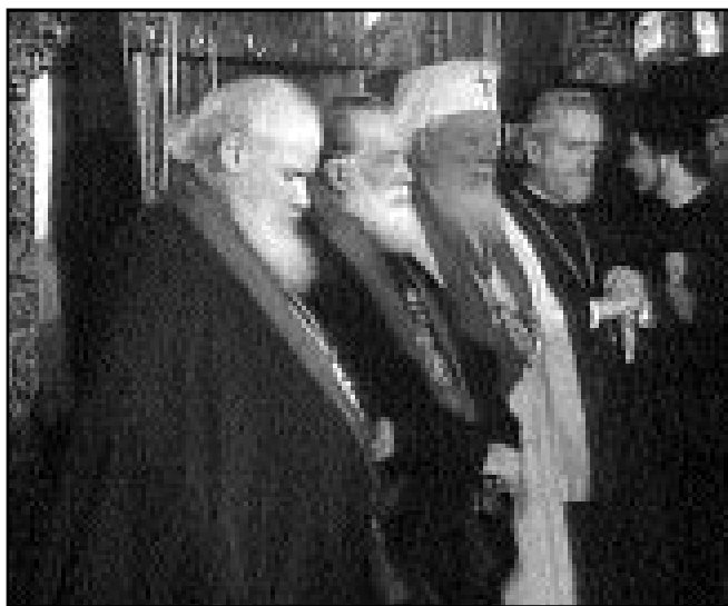
Betleem. Preafericiții Patriarhi Alexie al Moscovei, Ilia al Georgiei și Teoctist al României în timpul serviciului divin din 6 ianuarie

Majoritatea bisericilor din Palestina au fost distruse în timpul invaziei persane din sec. al VII-lea, însă Biserica Nașterii Domnului nu a fost profanată, se presupune