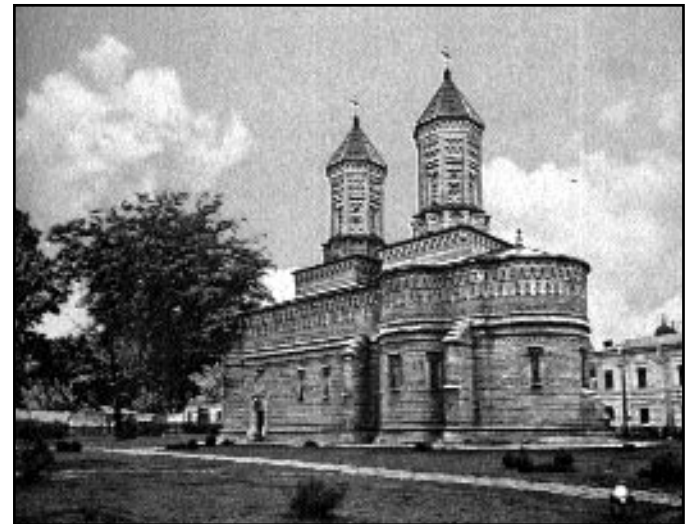
Iași. Mănăstirea “Sf. Trei Ierarhi”

ei. Cu rugăciunile acestor Trei Ierarhi, Hristoase, Dumnezeu nostru, și cu ale tuturor Sfinților,