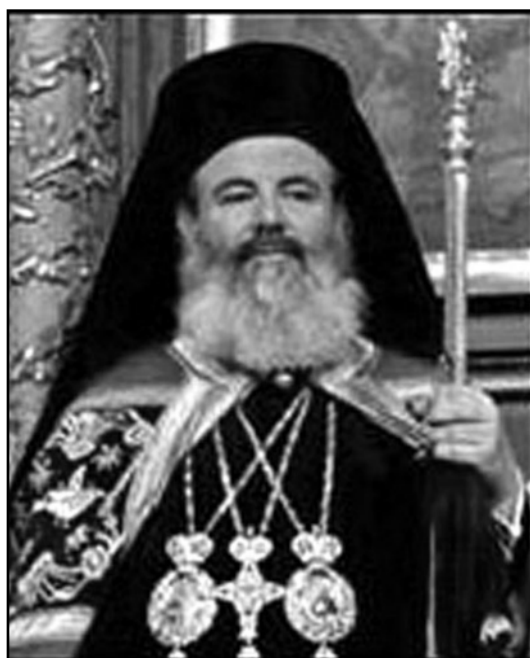
Prea Fericitul Hristodulos, Întâistătătorul Bisericii Ortodoxe a Greciei, s-a pronunțat pentru prima dată, la 7 februarie, cu privire

la distanțarea Bisericii față de stat, evocând o „separare de catifea” - informează Rompres. „Dacă tot trebuie să facem o separare a Bisericii față de Stat, de ce să nu o facem sub forma unei separări de catifea, existând posibilitatea, eventual, ca Biserica să nu fie prezentă la depunerea jurământului șefilor statului și al Guvernului”, a afirmat ierarhul grec cu ocazia unei conferințe la Atena. „Dar, nici nu ne dorim să scoatem icoanele (care sunt prezente mai ales în tribunale) sau să suprimăm orele de religie (obligatorii în școli)”, a mai adăugat prelatul. În legătură cu dezbaterile cu privire la separarea Bisericii față de Stat, dezbateri ce a căpătat o mare amploare în Grecia, ierarhia ortodoxă a mers până la o virulentă denunțare a oricărei perspective de laicizare a țării.