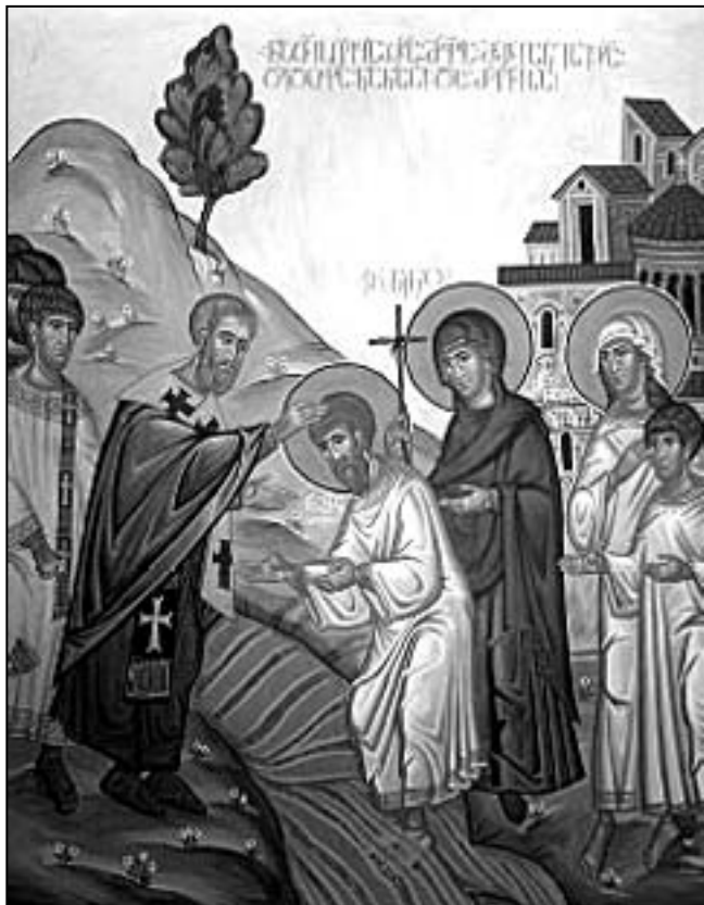
Botezul regelui Mirian

fost sprijinit de aceasta în lupta împotriva persilor, fiind obligat să încheie o pace grea, după doi ani de distrugeri și jefuiri. Atunci când învingătorii i-au cerut, însă, a refuzat să pornească la luptă împotriva Bizanțului creștin. Drept urmare, regatul său a fost din nou atacat de oștile păgâne și, după o rezistență eroică la graniță, în fruntea armatei sale puțin numeroase, monarhul a fost prins și executat.