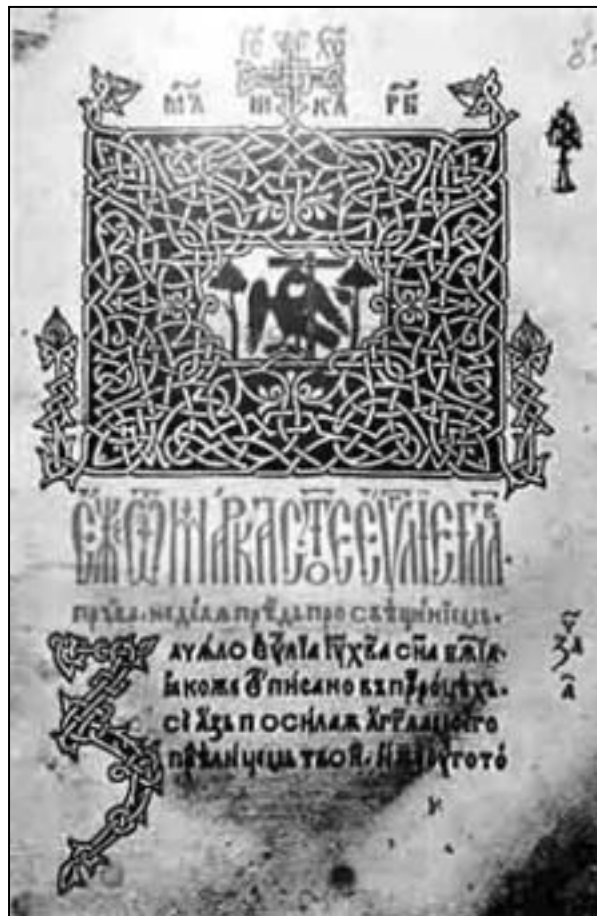
Liturgierul lui Macarie din anul 1508

Ziua de 10 noiembrie, reprezintă momentul în care Ieromonahul Macarie (1508) a editat, la Târgoviște, primul Liturgier ortodox și, totodată, prima carte tipărită de pe teritoriul țării noastre.