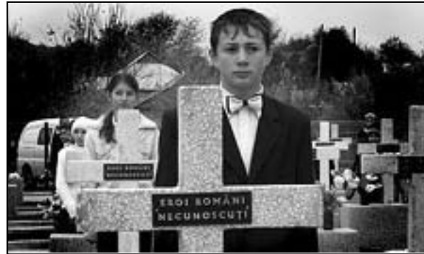
De gardă la Cimitirul de Onoare al Eroilor Români din s. Micleușeni

Pe 23 octombrie curent, în localitatea Micleușeni, r. Strășeni, a fost reinaugurat Cimitirul de Onoare al Eroilor Români. Astfel, după mai bine de 60 de ani de uitare forțată, cei peste 200 de soldați înmormântați la Micleușeni au avut parte de o slujbă religioasă și de cuvinte de recunoștință din partea celor prezenți.