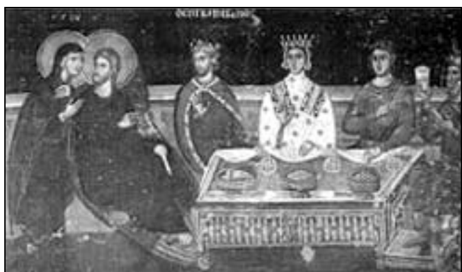
Nunta din Cana Galileei

Baza juridică a Cununii se află în Sf. Scriptură. Încă în rai fiind omul Dumnezeu a zis: „Nu este bine să fie omul singur; să-i facem ajutor potrivit pentru el” ( Facerea 2,1 ). Prin participarea Sa la nunta din Cana Galileei și prin săvârșirea celei dintâi minuni la aceasta nuntă, Mântuitorul a arătat că acordă o cinste și prețuire deosebită căsătoriei. După cum spune Fericitul Augustin: „Hristos a întărit la Cana ceea ce Dumnezeu a instituit în rai”.