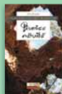
Biserica năruită Alexandru Lascarov-Moldovanu