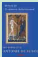
Reflecții. O călătorie duhovnicească Mitropolitul Antonie de Suroj