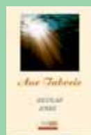
Aur taboric Nicolae Ionel