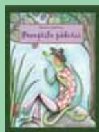
Poveștile pădurii Dionis Spătaru