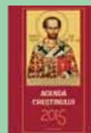
Agenda creștinului 2015