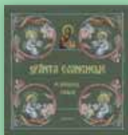
Sfânta Evanghelie pe înțelesul copiilor