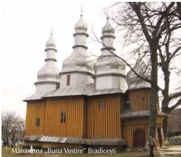
Mănăstirea „Buna Vestire” Brădicești

Mănăstirea „Adormirea Maicii Domnului” – Piatra Sfântă, jud. Iași, Mănăstirea „Sfântul Daniil Sihu” – Tărcuța, jud. Neamț, Mănăstirea „Buna Vestire” – Brădicești, jud. Iași, Schitul „Sfântul Ilie” – Cerebuc, jud. Neamț, Mănăstirea „Sfântul Onufrie” – Sihăstria Voronei, jud. Botoșani, Mănăstirea „Sfântul Vasile cel Mare” – Bodești, jud. Neamț, Mănăstirea „Sfinții Arhangheli Mihail și Gavriil” – Războieni, jud. Neamț, Mănăstirea „Izvorul Tămăduirii” – Horaița, jud. Neamț, Mănăstirea „Sfânta Treime” – Eșanca, jud. Botoșani, Mănăstirea „Înălțarea Domnului” – Golia, jud. Iași, Mănăstirea Bârnova, jud. Iași, Seminarul Teologic „Sfântul Gheorghe” din Botoșani, Parohia „Sfânta Cuvioasă Parascheva” – Bătrânești, jud. Botoșani, Protopopiatul Botoșani, Parohia „Adormirea Maicii Domnului” – Medeleni, com. Golăiești, jud. Iași, Protopopiatul II Iași, Parohia „Sfinții Voievozi” – Teioasa, Protopopiatul Darabani, Parohia „Sfinții Arhangheli Mihail și Gavriil” – Unguroaia, Protopopiatul Botoșani, Parohia „Sfânta Cuvioasă Parascheva” – Stânca, Protopopiatul I Iași, Parohia „Acoperământul Maicii Domnului” – Reditu Scânteii, Protopopiatul III Iași, Parohia „Ziua Crucii” – Botoșani, Protopopiatul Botoșani, Parohia „Sfinții Împărați Constantin și Elena” – Sărata, Drăgușeni, Protopopiatul Săveni.