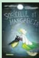
Șoricelul și margareta Gabriel Poenaru