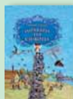
Împărăția lui Ciuboțel Spiridon Vangheli