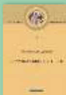
Cuvinte ascetice și epistole (vol. I) Sfântul Macarie Egipteanul