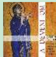
A DEVENI OM. Meditații de antropologie creștină în cuvânt și imagine Pr. John Behr