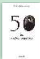
50 de predici populare Arhim. Iuliu Scriban