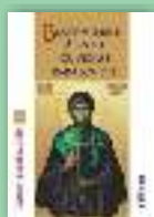
Binefacerile Sfintei Cuvioase Parascheva (vol. III)