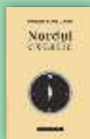
Nordul extatic Dorin Ploscaru