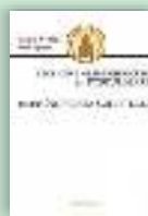
Zece cuvântări bisericești la Postul Mare. Despre îngrijirea sufletului Sfântul Nectarie de la Eghina