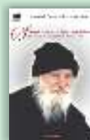
Sfântul Cuvios Porfirie Kavsokalivitul. Sfințenia în secolul al XXI-lea Monahul Patapios Kavsokalivitul