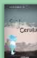
Copiii Cerului Aurelian Silvestru