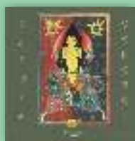
Cartea Genezei Gabriel Poenaru, Dionis Spătaru