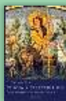
Crucea lucrează în lume. Omilii pentru perioadele liturgice de peste an Pr. John Behr