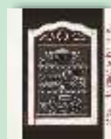
Carte de bucate boierești