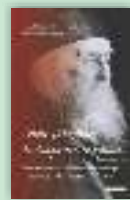
„Adu-ți aminte de dragostea cea dintâi (Apoc. 2, 4-5)”. Cele trei perioade ale vârstei duhovnicești în teologia Părintelui Sofronie Arhim. Zaharia Zaharou