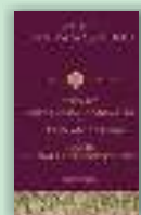
Cuvânt despre dreapta credință. Despre Sfânta Treime, Despre cântarea Trisagionului Sfântul Ioan Damaschinul