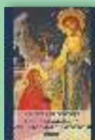
Sfânta Mironosiță Maria Magdalena, cea întocmai cu Apostolii