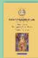
Scrieri I. Zece cuvinte despre poruncile lui Hristos. Cincizeci de capete Sfântul Neofit Zăvorâtul din Cipru