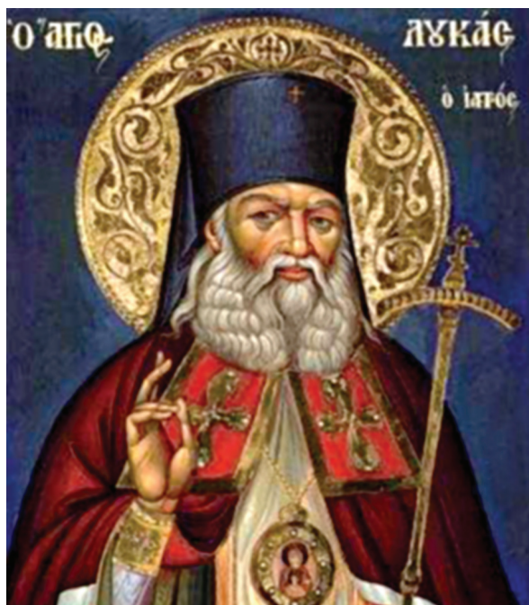
Sfântul Luca al Crimeei