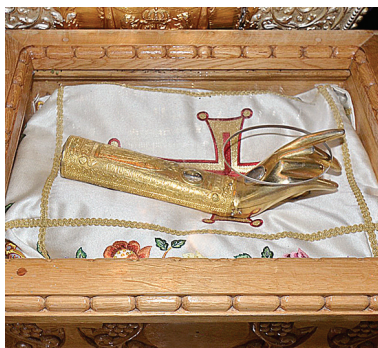
Moaștele Sfântului Policarp, spre închinare la Iași

P e 13 iunie 1641, Iașul primea de la Patriarhia Ecumenică, în semn de recunoștință pentru ajutorul financiar acordat de domnitorul Vasile Lupu, iubitor al Bisericii lui Hristos, un mare dar: moaștele Sfintei Cuvioase Parascheva. De atunci, în fiecare an, pe 14 octombrie, Sfânta Vineri, cum este numită în popor, sau Cuvioasa, cum o invocă în rugăcini pelegrinii, este cinstită în mod deosebit în cetatea Moldovei. Au trecut 370 de ani de când Cuvioasa Parascheva ocrotește Iașul și întreaga Moldovă, dar timpul mântuirii noastre a dovedit că dragostea exprimată prin cultul adus Sfintei este adânc înrădăcinată în tradiția Bisericii Ortodoxe Române, iar binefacerile sale se revărsă asupra întregii României.