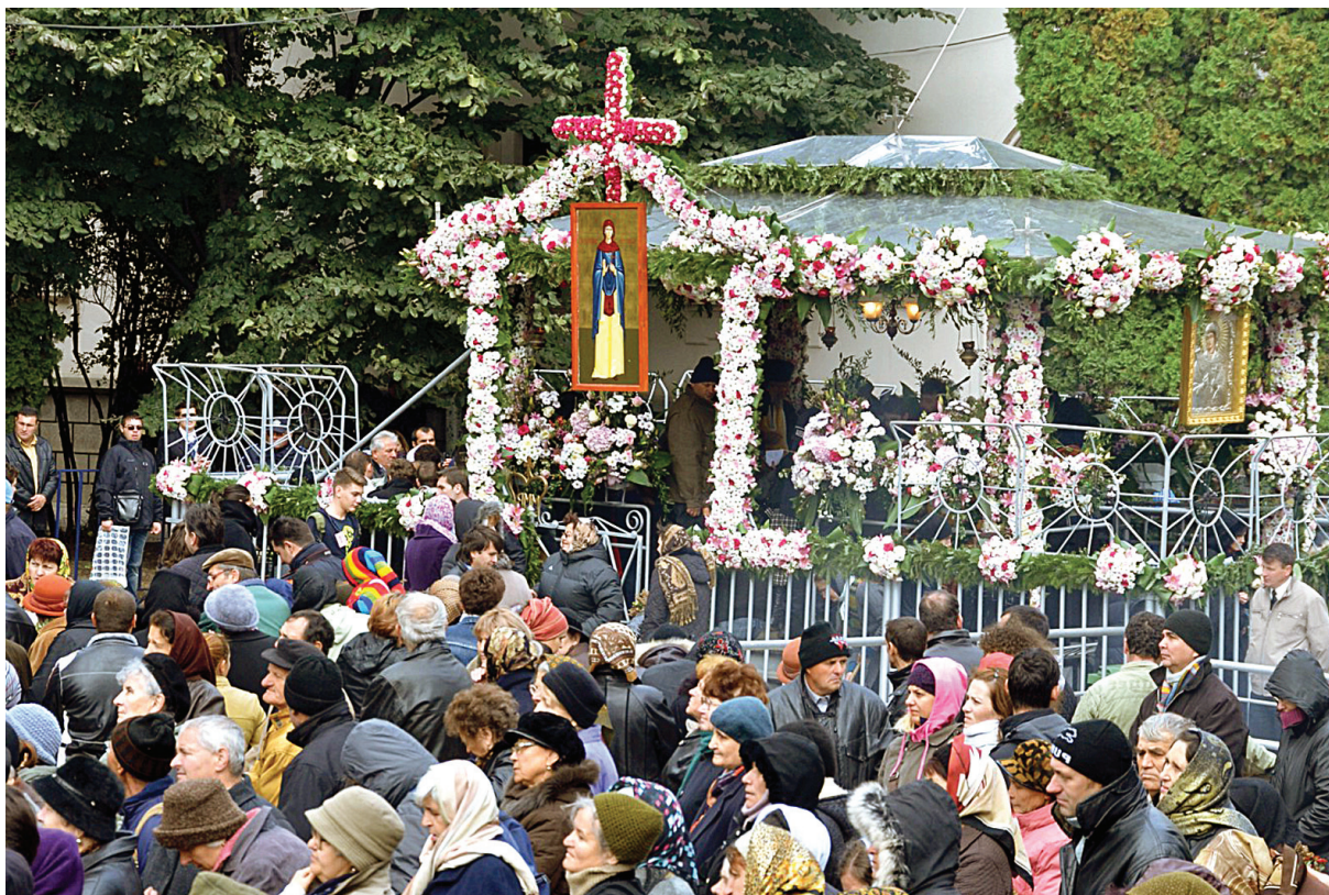
Hramul Sfintei Cuvioase Parascheva: