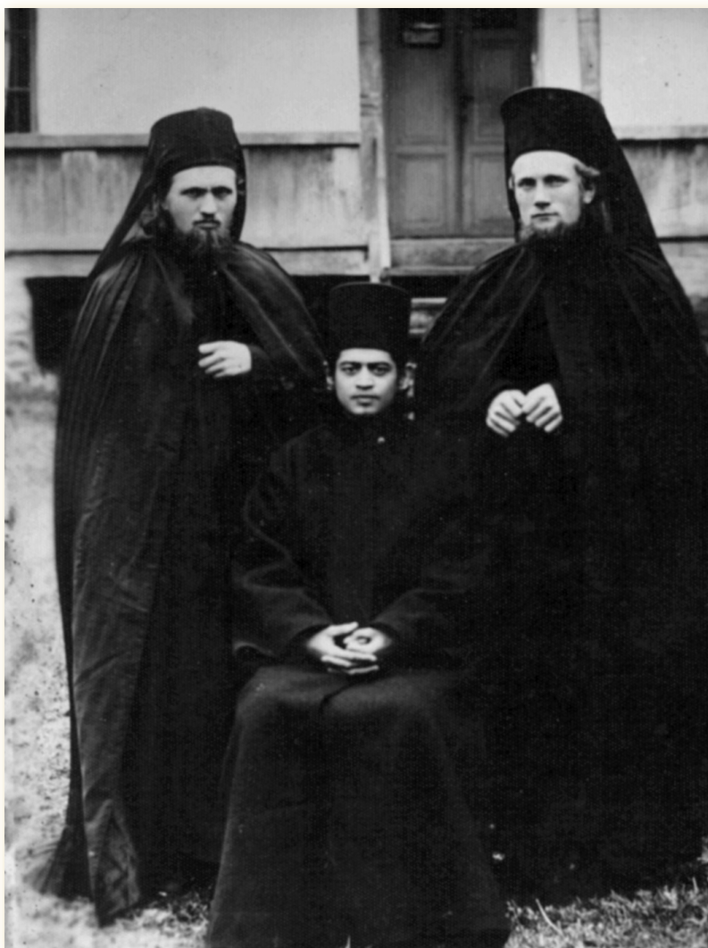
Sfântul Ioan Iacob (în stânga) în ziua călugăriei sale, alături de ceilalți frați de călugărie