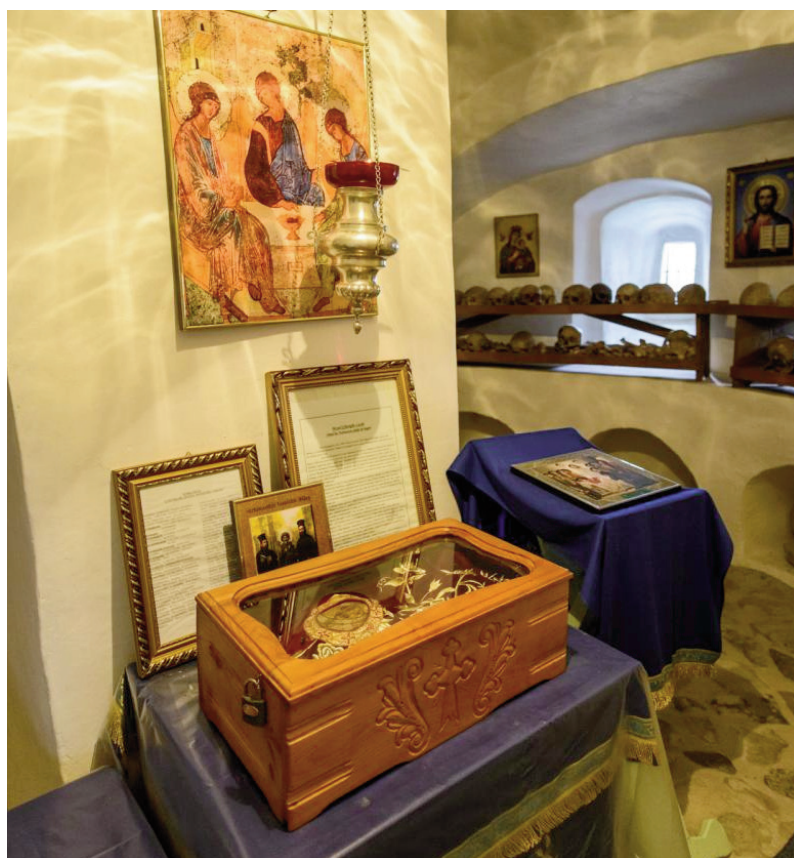
Racla cu moaștele Sfântului Gheorghe Pelerinul, păstrată în osuarul Mănăstirii Vărativ