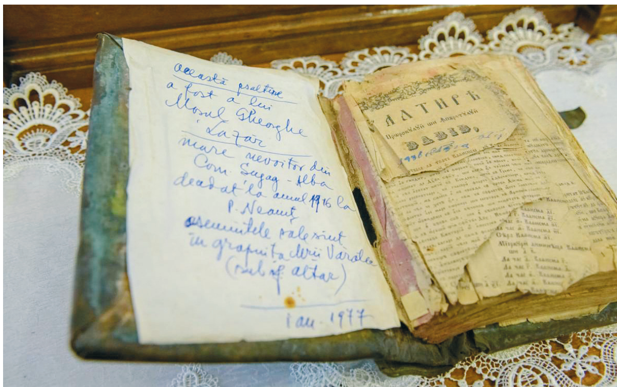
Psaltirea Sfântului Gheorghe Pelerinul, păstrată la Mănăstirea Văratec