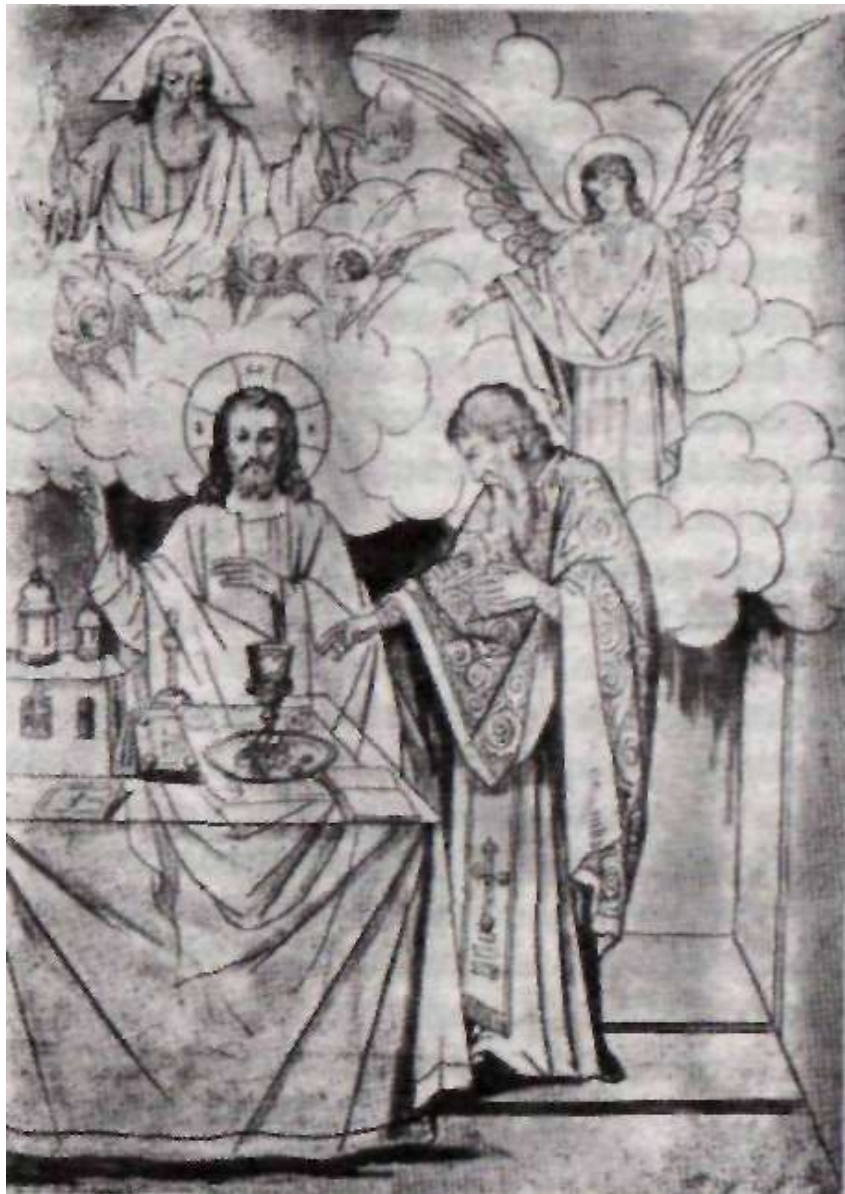
Prefacerea Sf. Daruri în Trupul și Sângele Domnului.

"Și fa pâinea aceasta, cinstit Trupul Hristosului Tău". După aceea și spre potir grăind: "Iar ce este în potirul acesta cinstit Sângele Hristosului Tău"; "prefăcându-l cu Duhul Tău cel Sfânt", adaugă la urmă binecuvântând peste amândouă.