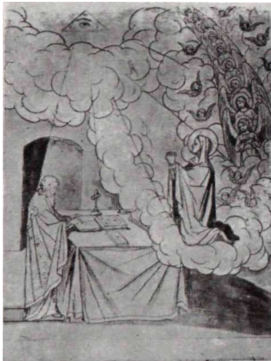
Maica Domnului se roagă în genunchi pentru creștini în timpul Sf. Liturghii

Astfel s-a arătat câtă putere revărsă în suflete credința nezdrușcinată în Hristos care luminează și întărește pe om și s-a plinit și cuvântul patriarhului Metodie, că vor primi cununa mucenicească pentru Hristos și de la Hristos Dumnezeu nostru, a căruia este puterea și slava în veci. Amin.