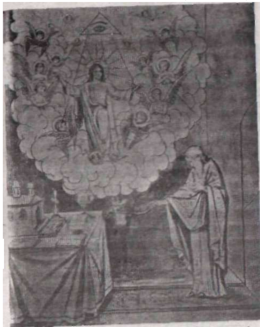
Mântuitorul înconjurat de îngeri, se înalță la cerun.

în ușile altarului, grăind și chemând cu căldura la sine: "Cu frica lui Dumnezeu, și cu credință,