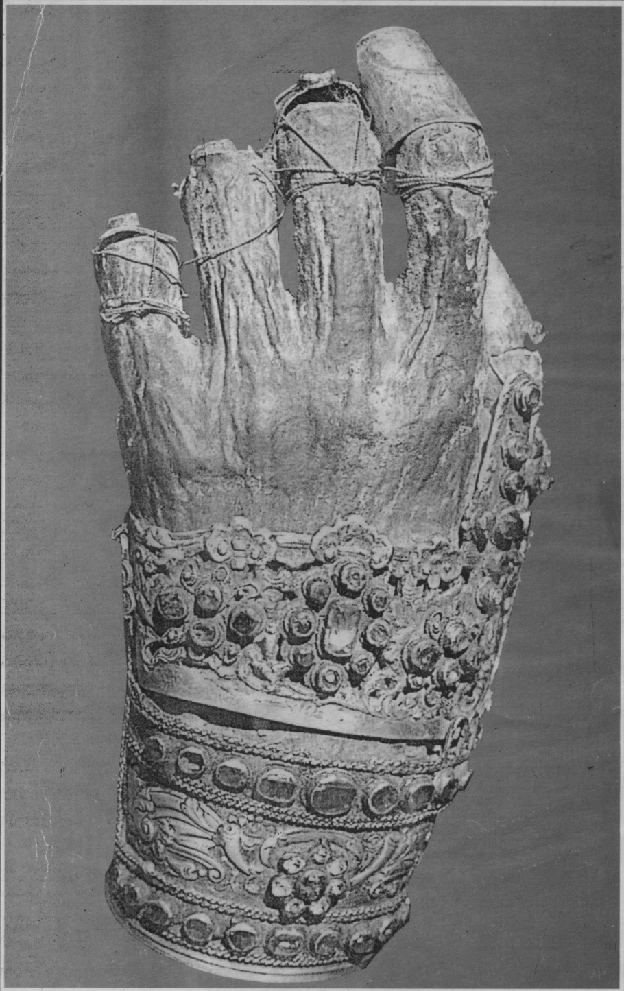
INTEI E MOAȘTE - MINA SFINTEI ILIJOAN GURA DE AUR (+407) DE LA MANASTIREA FILOTIC - SFINTEI MUNTE ATHOS - GRECIA