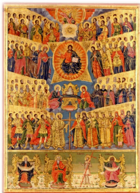
133. Οι Άγιοι Πάντες (50 X 72). 19ος αιώνας. All Saints (50 X 72). 19th century.