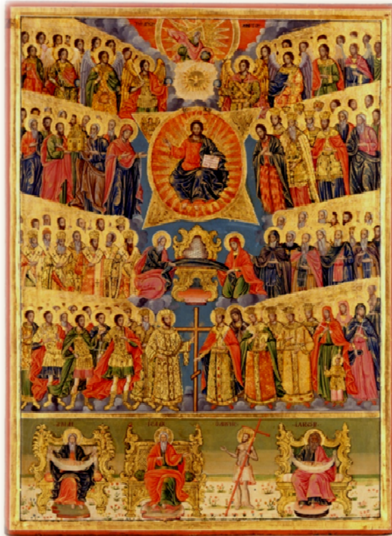
133 Ch. dyati Plovrec (50 X 72), 19th century All Saints (50 X 72), 19th century