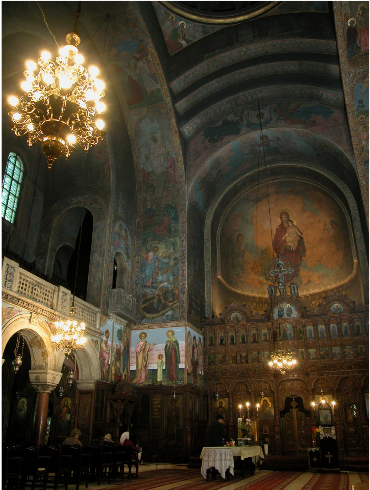
Interiorul Bisericii Sf. Elefterie Nou din București

Pictură relizată de Părintele Arsenie Boca