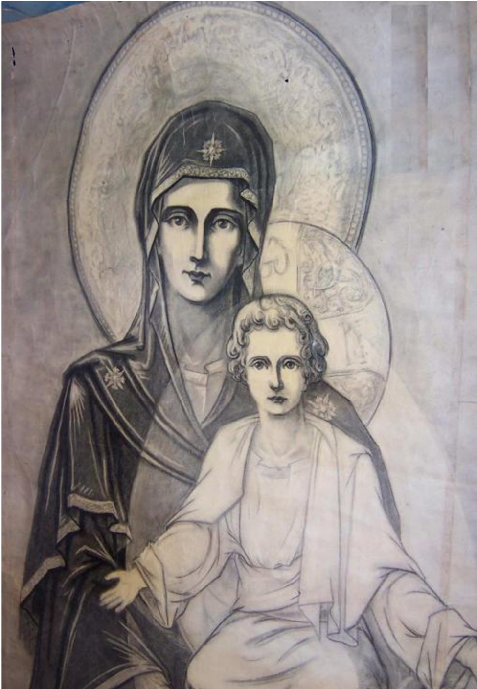
Schița a Părintelui - Fecioara cu Pruncul in zeghe - găsită în Biserica Sf. Nicolae din Drăgănescu