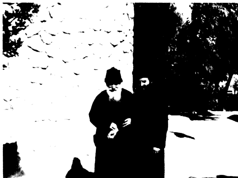
Părintele pune diagnostice luând pulsul. Plimbare și îndrumare.