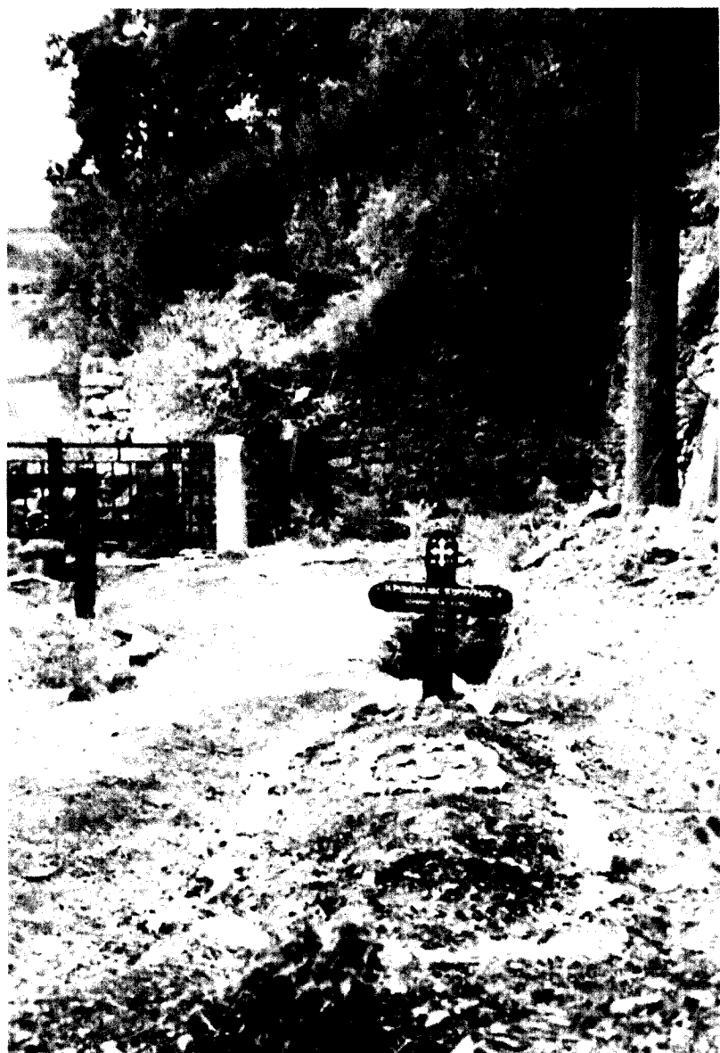
Mormântul simplu de la Kafsokalivia al Părintelui Porfirie.