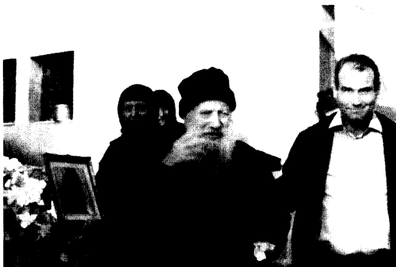
Bătrânul vizita adesea mănăstirile de maici, pentru a căror propășire se ruga neîncetat