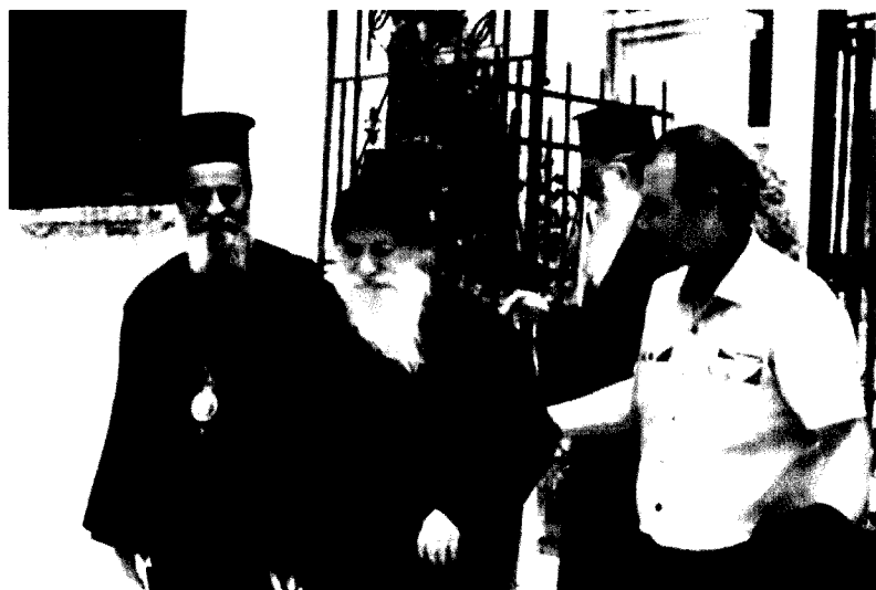
Vizitând Sfânta Mitropolie din Karystia