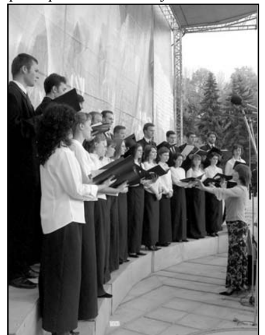
Corul bisericii „Sf. Dumitru”