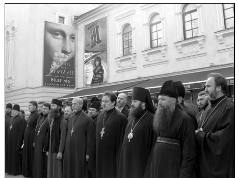
Secvență din cadrul manifestației de protest din 18 mai 2006

Sărăcia spirituală, incultura, ura față de Hristos și goana după profit au găștigat și de data aceasta.