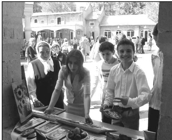
Secvență de la expoziția organizată de copiii de la biserica „Sf. Dumitru” din Chișinău

Către Ziua Internațională a Ocrotirii Copilului Mitropolia Chișinăului și a întregii Moldove s-a implicat în desfășurarea mai multor manifestări consacrate acestui eveniment.