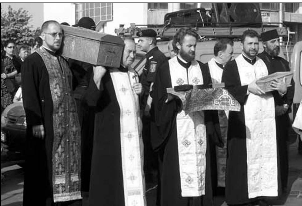
Secvență de la întâlnirea moaștelor Sf. Apostoli Petru și Pavel și a celor cinci mucenici de la Niculițel