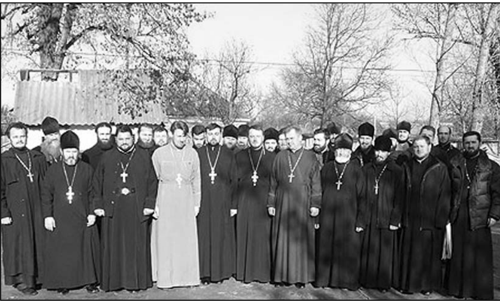
Participanții la adunare