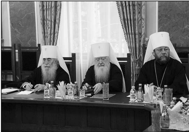
ÎPS Vladimir în cadrul ședinței Sfântului Sinod al Bisericii Ortodoxe Ruse