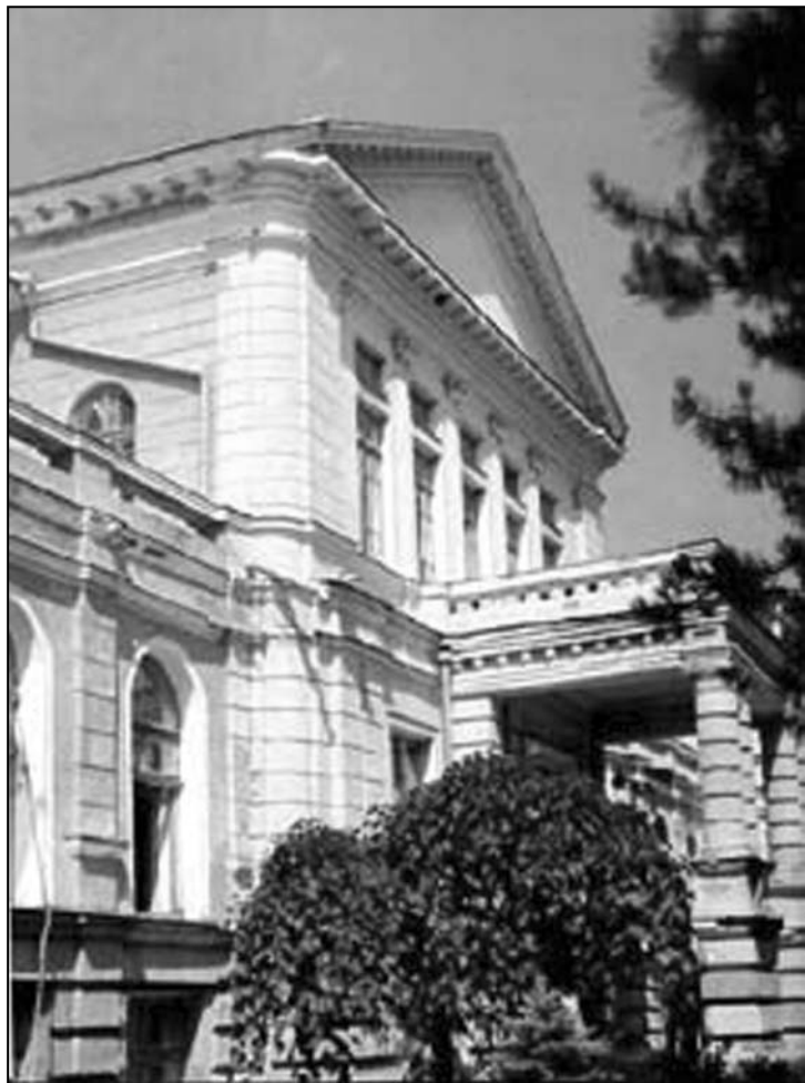
Clădirea Sfatului Țării unde la 27 martie (stil vechi) 1918 s-a votat Unirea

“Patriotismul este nu numai dragostea pentru pământ; este dragostea pentru trecut, este respectul pentru generațiile care ne-au precedat.” (Fustel de Coulanges)