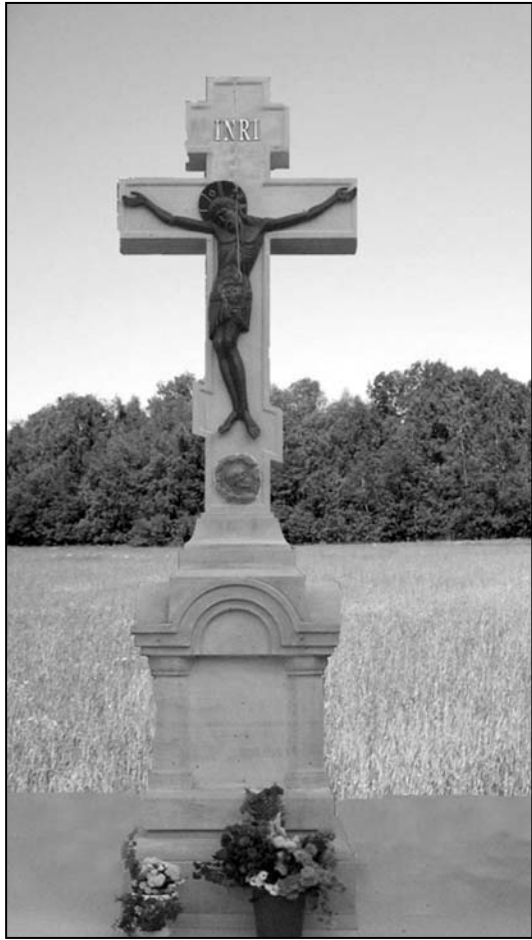
Răstignire în memoria PS Dorimedont

Iubirea nu are margini ea nu se supune distanțelor și timpului, nu se consumă niciodată. Anume aceste sentimente au motivat lucrarea ce s-a săvârșit în satul Viișoara, r-nul Glodeni în ziua de 25 noiembrie 2008, și, desigur, aflarea noastră acolo.